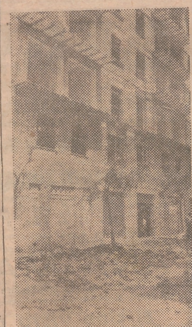
1.—Un aspecto de la finca en la que se produjo el trágico accidente. 2.—Momentos después de la catástrofe, una brigada de obreros procede a retirar los escombros.