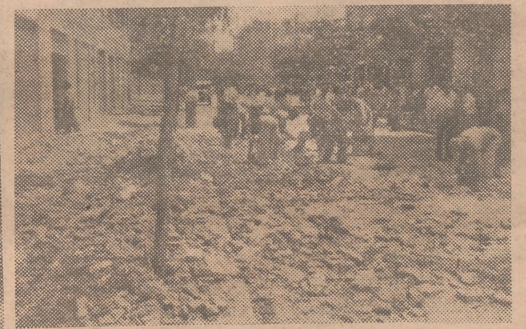
construcción, en la calle de la Reina Doña Germana, donde se produjeron los hechos. 2.—Momentos después de la catástrofe, una brigada de obreros procede a retirar los escombros.