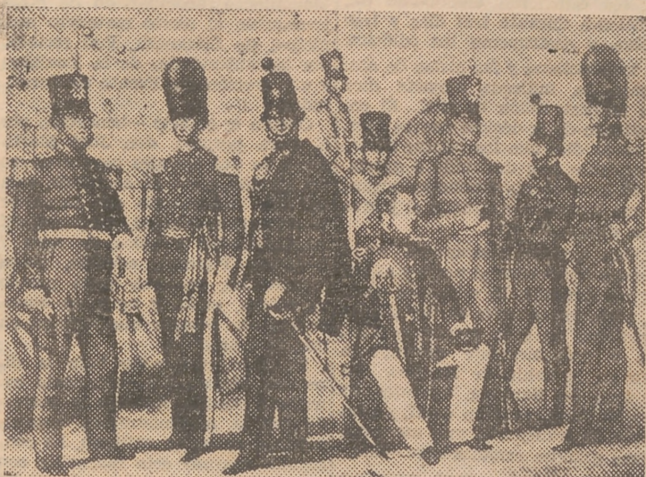
Grabado que representa los uniformes de los oficiales de la Honorable Compañía de Artillería de la City, de Londres, a mediados del siglo XIX

Aun en aquella época, la Honorable Compañía de Artillería era una unidad venerable. A ella acudían voluntarios de muchos lugares. El ingeniero jefe de Luis XIV, Vauban, aprendió los principios de la fortificación en el Jardín de Artillería, al lado del gran estratega del siglo XVII, hijo de un Winston Churchill y antecesor de otro, que se immortalizó con el título de duque de Marlborough. Su historia data del 25 de agosto de 1537, fecha en que el rey En-