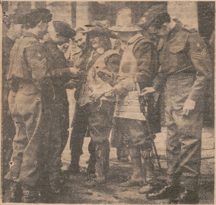
Un grupo de cadetes de la Compañía de Artillería de la City, de Londres, examinando los uniformes de los picadores del siglo XVII, que asistieron a la ceremonia de la toma de posesión del Lord Mayor de la ciudad

Le horrorizaba el detalle y detestaba lo violento. Hombre de buen gusto, era lógico al obrar y romántico al pensar; no parece obstinado y es su salvación confiarse plenamente a los límites que le imponen sus equilibradas facultades, y sólo deja incontrolados los sentimientos, que se desbordan y prenden en sus obras la emoción más noble.