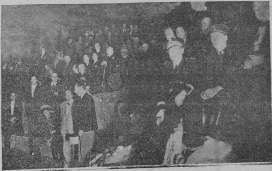
Grupo de asistentes a la inauguración del alumbrado en las cuevas del Drach.

La lucha de clases es consecuencia del sistema, y los sistemas son todos iguales. Precisa conocer una doctrina que establez-