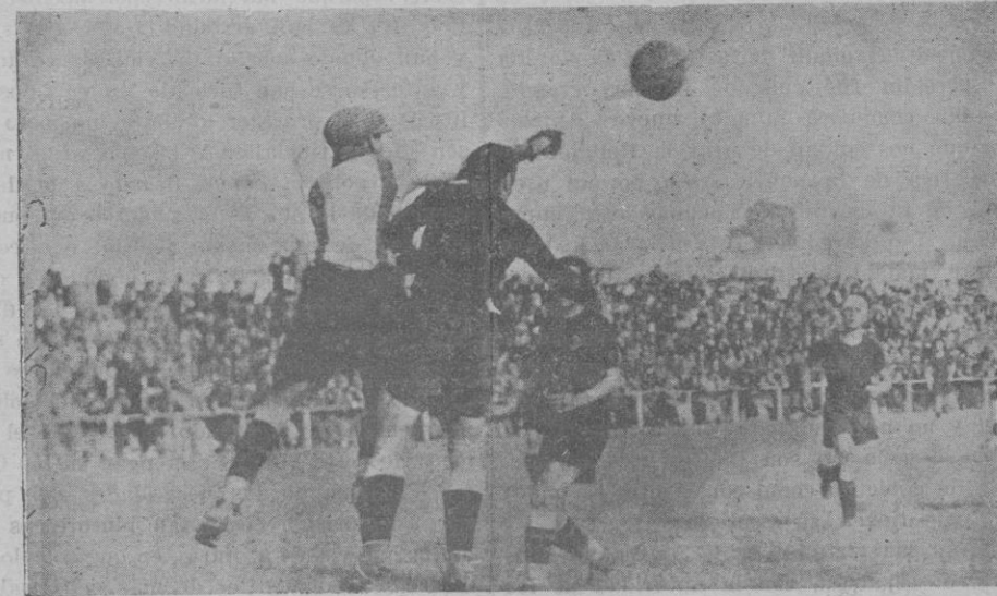
Abad, despeja por puño un balón, acosado por el delantero contrario.