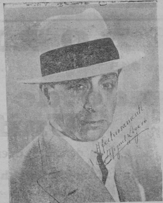
El graciosísimo actor de la pantalla que hoy se presentará al público de Palma, en el "Salón Mallorca".