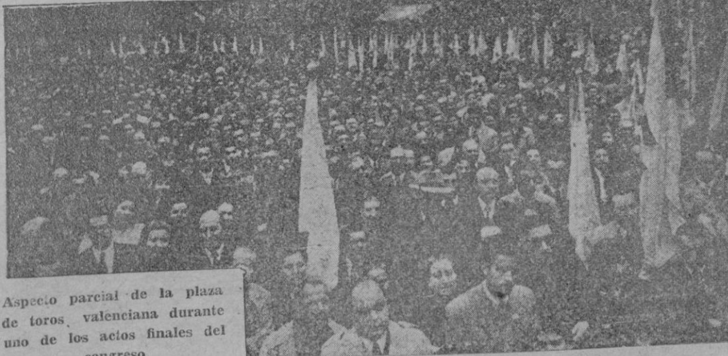
Aspecto parcial de la plaza de toros, valenciana durante uno de los actos finales del congreso