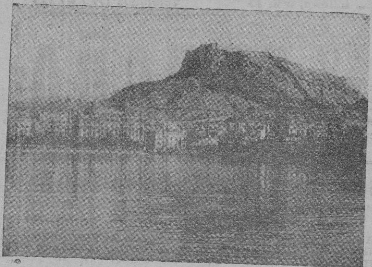
La bahía de Alicante. En primer término, la Ciudad. Al fondo el castillo de Santa Bárbara, donde fué fusilado el fundador de la Falange

...cia, como por la serenidad y la serenidad y parece que en el momento del Jurado hubo discrepancias, pero se impuso la amonestación de la pistola del mozo de guardia apellidado Domínguez que exigió unas contestaciones que implicaban la sentencia de muerte.