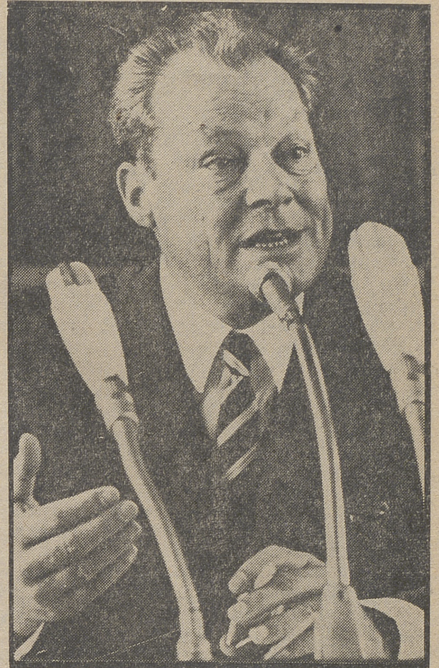
En reconocimiento a sus fundamentales esfuerzos para el fortalecimiento de las posibilidades de un futuro pacífico en Europa y en el Mundo, le fue concedido el Nobel de la Paz 1971 y las 450.000 coronas suecas correspondientes al Canciller de Alemania Federal Willy Brandt, entre los treinta y nueve candidatos al mismo.