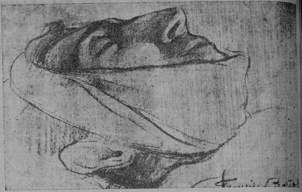
Dibujo de la mascarilla del infortunado diestro, obtenida momentos después de su muerte.