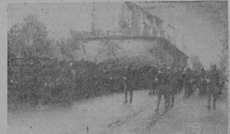
El marcial desfile de los infantes ante S. E. y demás Autoridades y Jerarquías