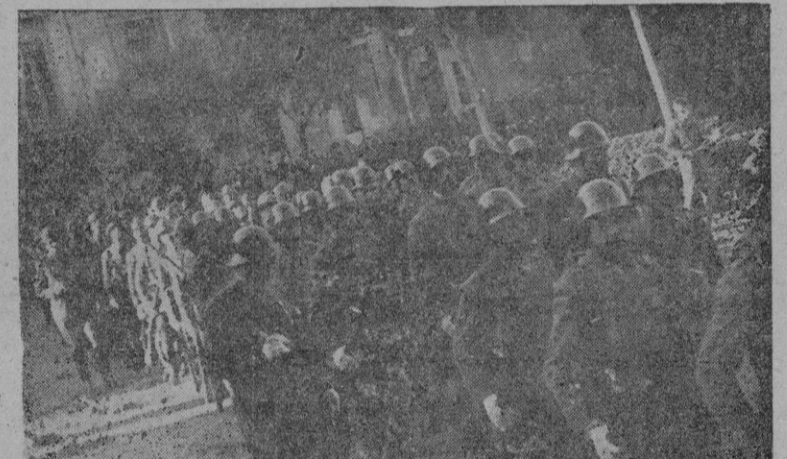
Terminada la misa, los soldados se dirigen al lugar señalado, para iniciar el desfile

El Excmo. Sr. Capitán General fué despedido en la puerta del cuar-