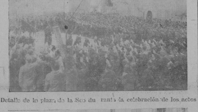
Detalles de la plaza de la Seo durante la celebración de los actos