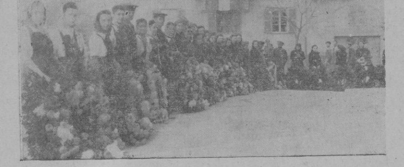
Las falangistas de la 'Hermandad de la Ciudad y el Campo' con las coronas que las autoridades depositaron ayer bajo el nombre de José Antonio