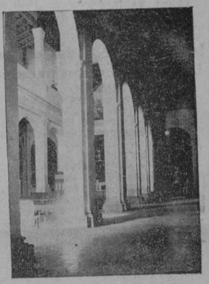
Otro aspecto de la nueva iglesia tomado desde el fondo de la nave derecha

La nueva iglesia, de tipo basilical romano, es un monumento en cuya construcción todo el pueblo tiene su parte