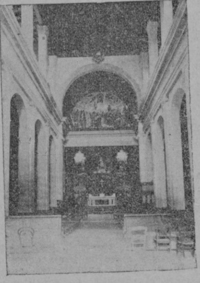
La nueva iglesia parroquial de San Juan. Foto tomada desde el portal mayor