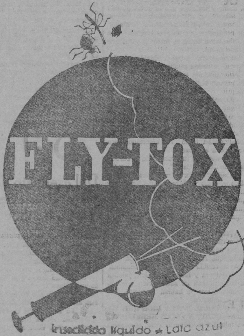
Insecticida líquido * Lata azul