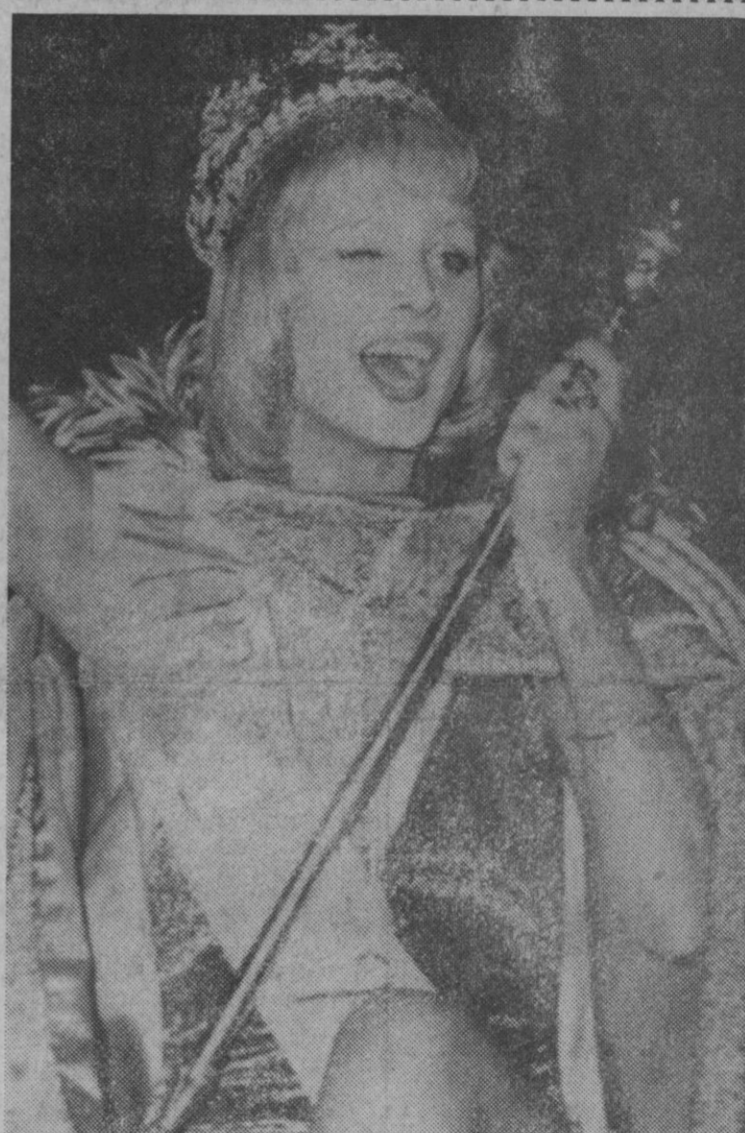
Londres.—Belinda Roma Green saluda y guiña un ojo en señal de alegría al ser coronada como «Miss Mundo 72» en el Royal Albert Hall de esta ciudad. Belinda Roma Green representaba a Australia.

La producción hidroeléctrica desde el primero de año hasta el mes de noviembre ha sido de 32.616,65 millones de kilowatios-hora, que comparada con el mismo periodo del año anterior, que fue de 30.575,15 millones de kilowatios-hora, representa una diferencia en más de 2.041,50 millones, equivalente a un aumento del 6,68 por ciento.—Cifra.