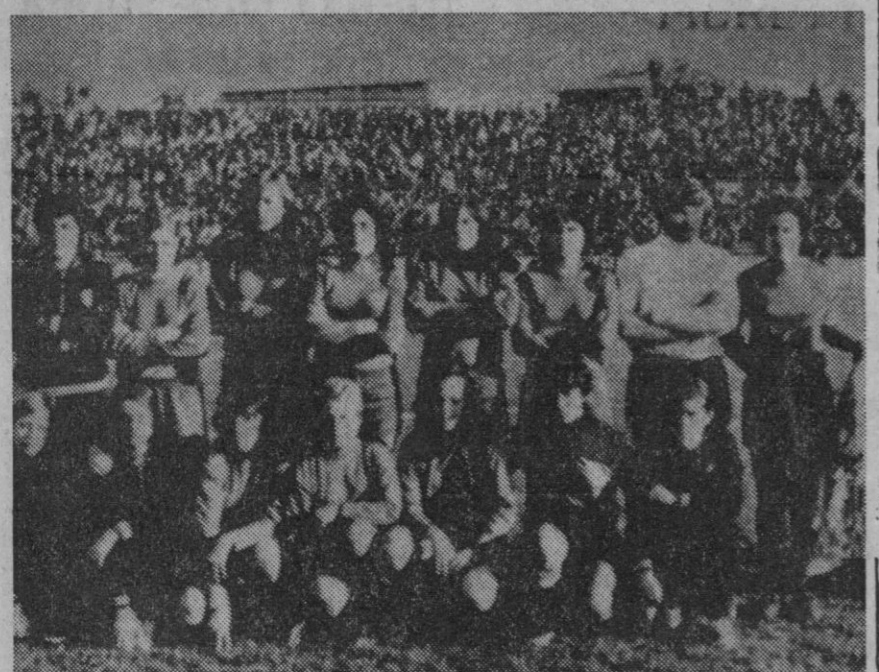
Estas estupendas muchachas son las «Kubala-girls» de nuestro fútbol femenino, la primera selección nacional, que los próximos días 8 y 10 de diciembre se enfrentarán al equipo de Italia en Córdoba y Badajoz en partidos del Torneo Adriático. El jugador número 12 está dispuesto.