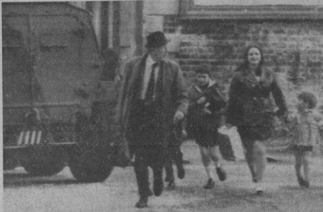
Belfast.—Los chicos son acompañados por personas mayores en su regreso a casa desde la escuela durante un tiroteo en el área de Lower Falls, donde una mujer armada con una pistola fue alcanzada por los disparos de las tropas británicas. También murió un soldado inglés, y un tirador.

Tarragona, 4.—Una partida de balones de fútbol reglamentarios valorada en 34.000 pesetas, ha sido robada de un remolque que había aparcado en la zona franca de esta ciudad.