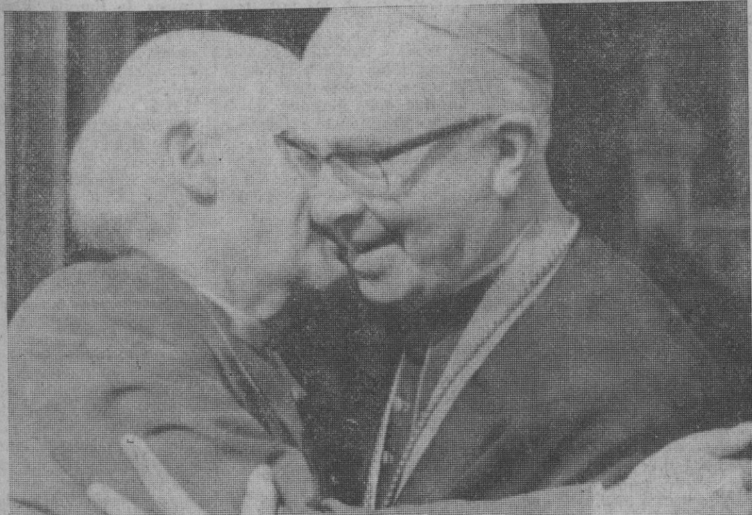
Londres.—El cardenal Jan Willebrands (derecha), presidente de la Secretaría Vaticana para el Desarrollo de la Unidad Cristiana, recibe la bienvenida del doctor Michael Ramsey, arzobispo de Canterbury en el palacio Lambeth. Mañana el cardenal se convertirá en el primer católico desde la Reforma que oficie una misa en la capilla del palacio Lambeth.

Seguidamente el primer ministro británico fue acompañado por varios prelados vaticanos al estudio del cardenal Villot, para efectuar una visita protocolaria al secretario de estado. A las 11,05, Heath abandonó el Vaticano, dirigiéndose con su séquito hacia el aeropuerto de Ciampino para viajar en un avión especial a visitar Florenza.—Efe.