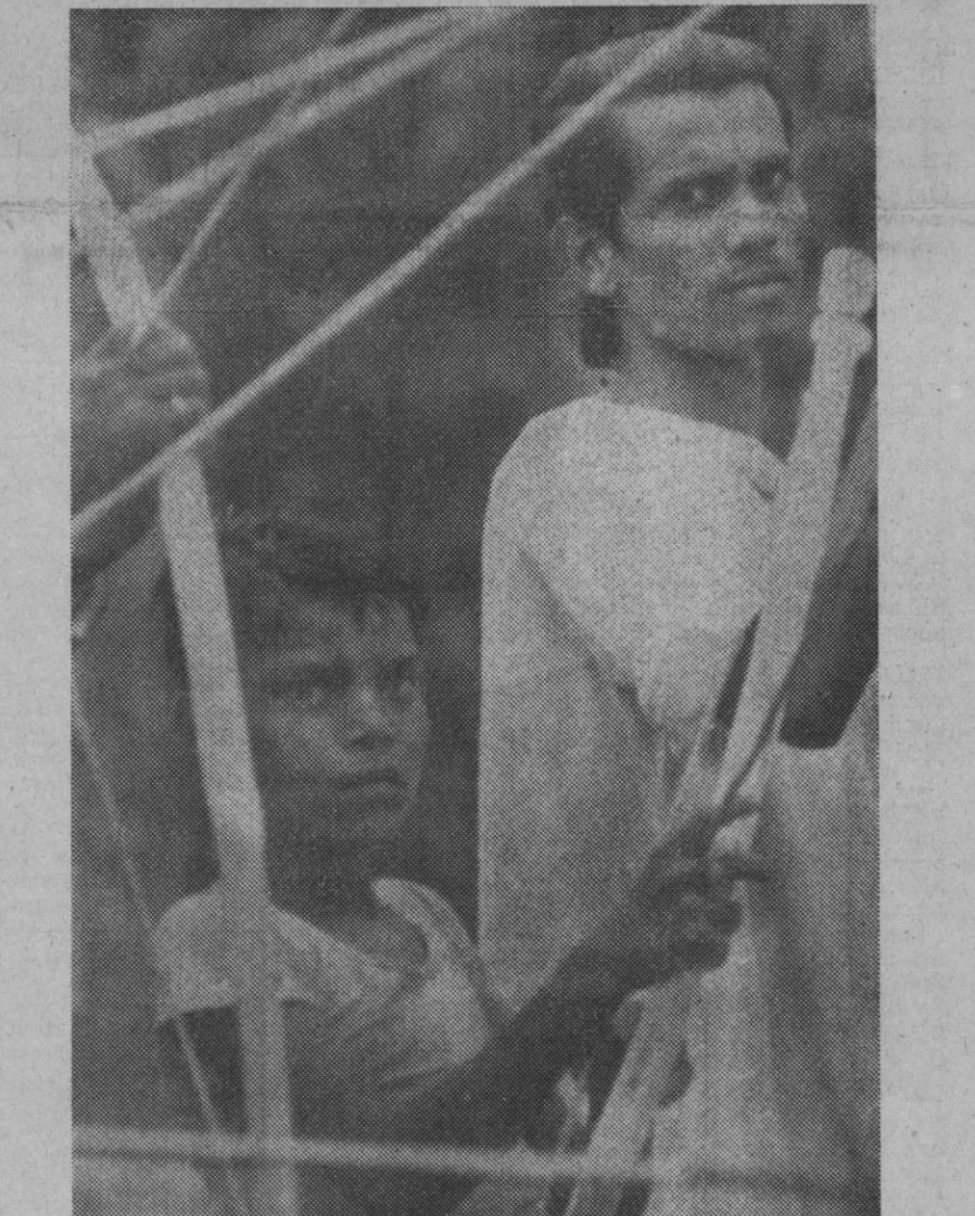
Pangsha (Pakistán Oriental).—Civiles pakistaníes aparecen con arcos y flechas proclamando su deseo de combatir por la independencia con los medios a su alcance.

El procesado Carrillo, que reside en París, ocupó puestos destacados en las última etapa de la dominación marxista en España, así como su padre, Wenceslao, que fue un militante socialista de sobresaliente actuación.—Cifra.