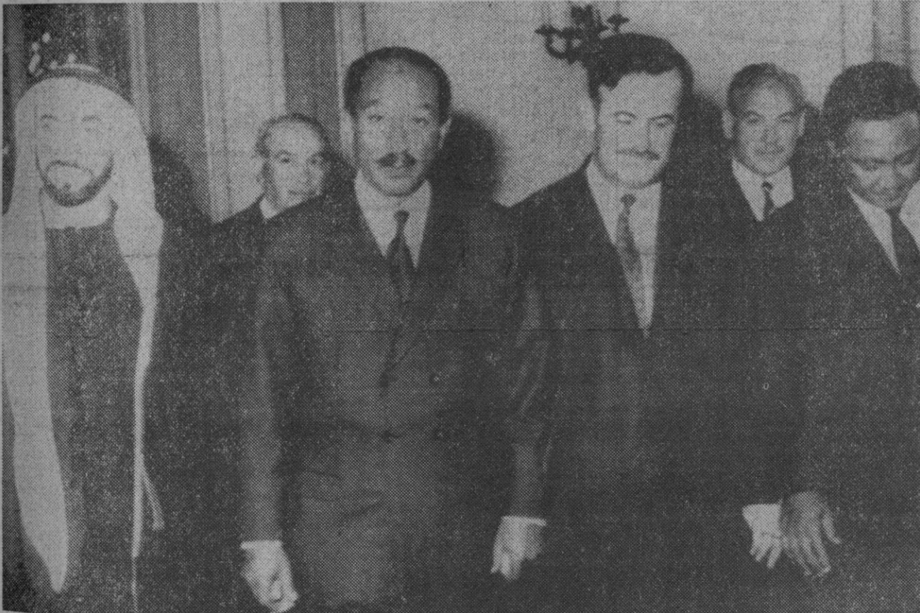
El Cairo.—Desde la izquierda: el jeque Zayed Ibn al Nahian, de Abu Dhabi; el presidente de la Rau, Anwar El Sadat; el presidente sirio Hafez Assad, y el presidente del Sudán, Gaafar El Numeiri, a su llegada al palacio de Abdin para una cena de gala ofrecida por el presidente Sadat.

Todos los hospitales y centros médicos franceses están siendo dotados actualmente de varios millones de vacunas y de fanasil, producto sulfamídico descubierto recientemente y que tiene propiedades preventivas y curativas contra el cólera. Al mismo tiempo, se ha ordenado intensificar los controles sanitarios en las fronteras marítimas y aéreas y se va a establecer otro en las fronteras terrestres.—Efe.