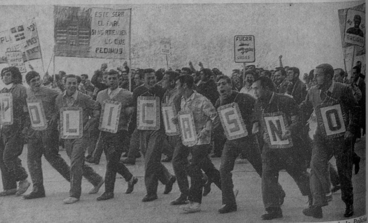
Madrid.—Durante la visita del ministro de la Gobernación, don Tomás Garicano Goñi, a la Escuela de la Pólvora Armada, un grupo de cadetes de la citada Escuela hacen un simulacro de "manifestación contra los grises", mostrando su buen humor... incluso en las pancartas se alude a los clásicos tópicos contra estas fuerzas. Un grupo especial "disolvió" rápidamente la manifestación.—(Foto Europa Press)

Esta es la realidad del problema, que alcanza caracteres dramáticos en los casos de los encargados de clase y ayudantes.—(De «N D».)