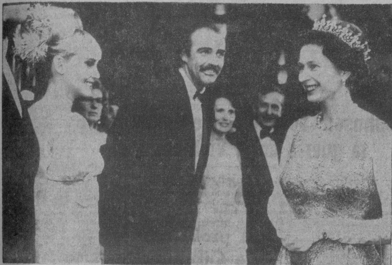
Sean Connery durante la recepción concedida por la reina Isabel de Inglaterra, con motivo de haber asistido a la proyección en Londres de la última película del famoso agente «007», «Solo se vive dos veces».

Sean Connery ha sido siempre un verdadero problema para los encargados de su publicidad. Nunca