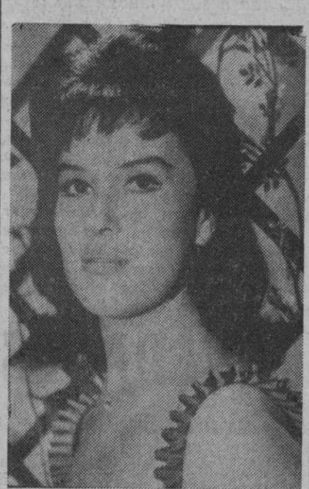
La actriz mejicana Lucha Villa

El cine se ha volcado en el tema Pancho Villa. Ya les hemos hablado de la película de «El Indio» Fernández, premiada en Moscú; tam-