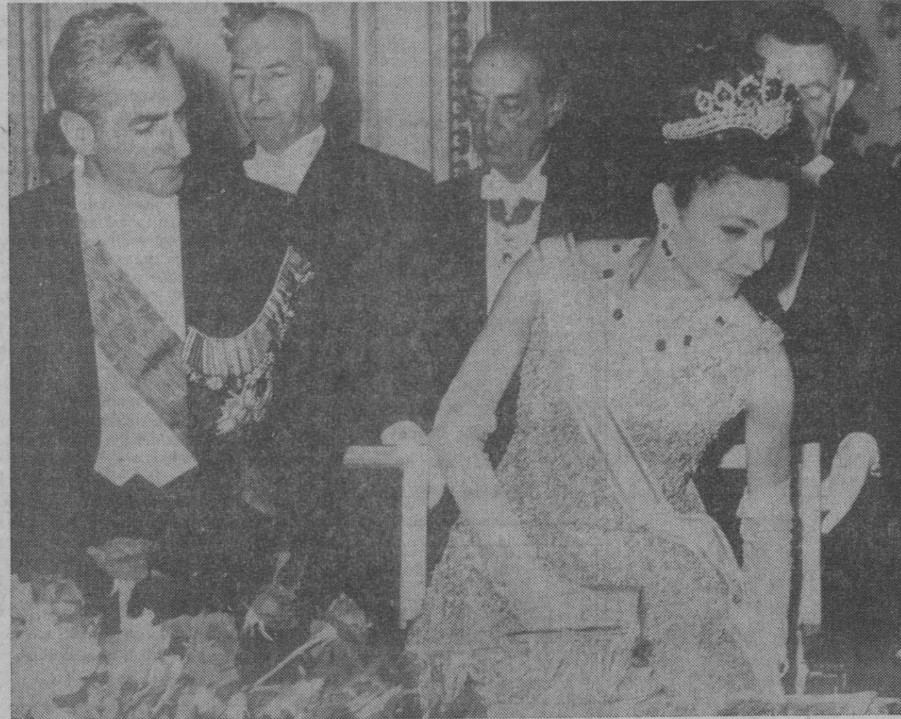
El sha, siempre atento a su bella esposa.

ta y ocho años de edad, y el pequeño Reza Cyrus se convierte en el príncipe heredero.