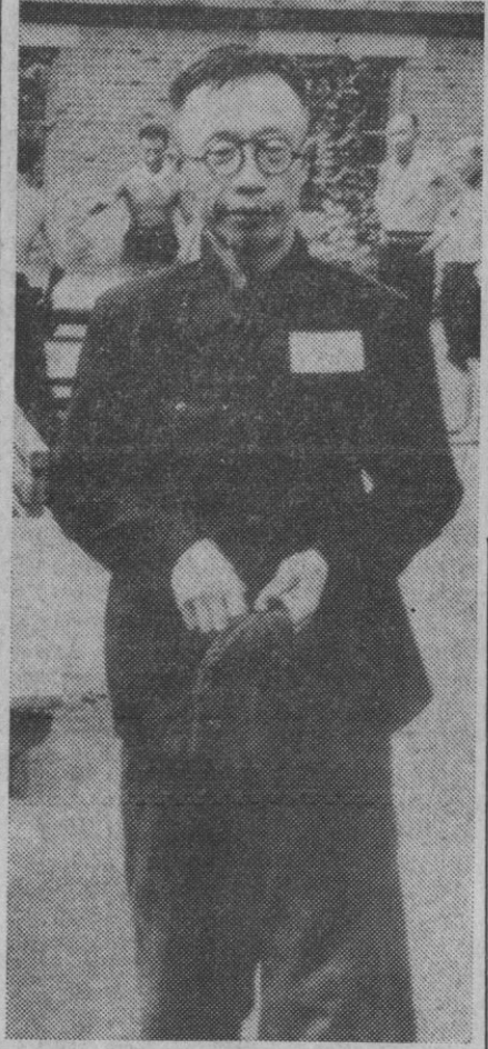
Henry Pu Yi, el último de los emperadores de China, que ha muerto a la edad de sesenta y un años. Cuatro veces fue emperador y las cuatro fue depuesto o se vio obligado a huir. Los rojos le tuvieron en prisión hasta mil novecientos cincuenta y nueve. A partir de mil novecientos sesenta y uno trabajó en los jardines botánicos de Pekín.

Hussein fue recibido en el aeropuerto por el embajador de su país y otras personalidades árabes.