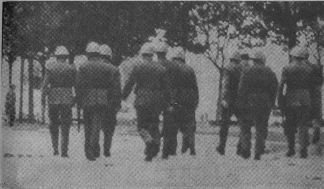
Madrid.—La policía deshizo rápidamente un intento de manifestación de cuatrocientos estudiantes, contra la guerra de Vietnam. Aquí vemos a varios policías atravesando el campo de la Universidad. Al fondo se ve alguno de los manifestantes.

La previsión del servicio meteorológico, para esta tarde y noche en Cataluña señala mejora del tiempo por el interior y posibilidad de nuevas lluvias por la zona del litoral.—Cifra.