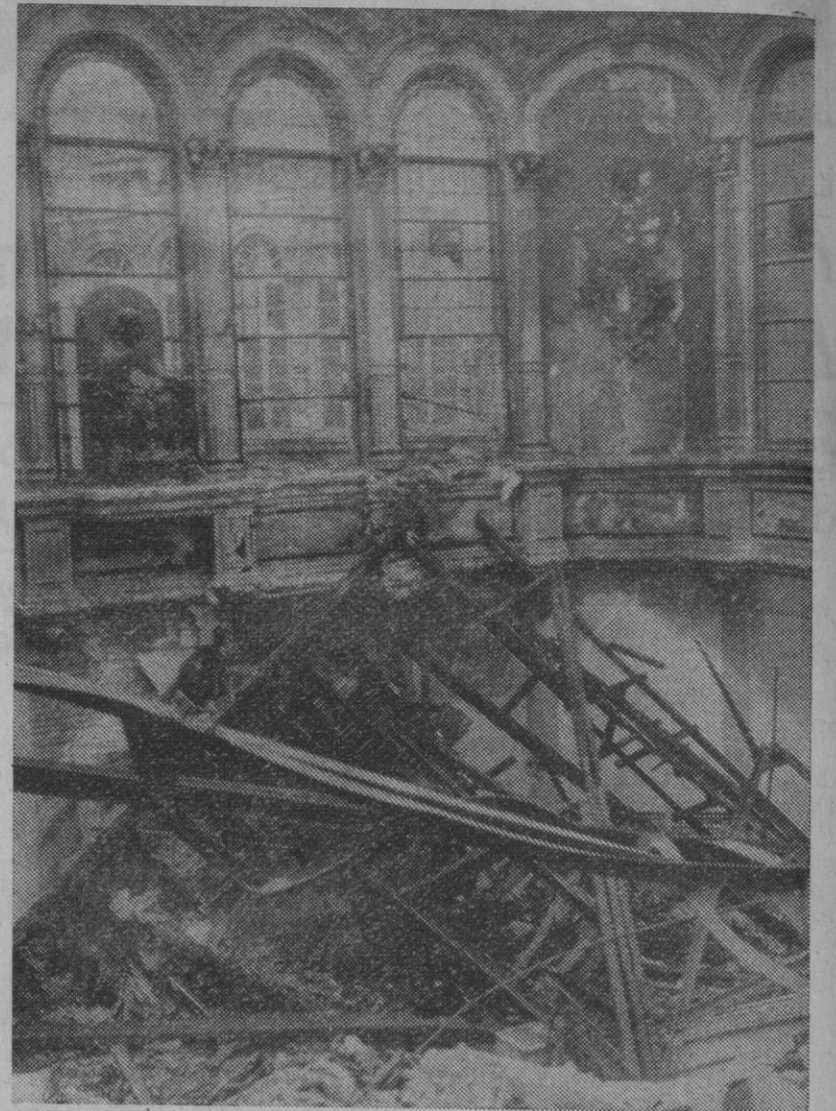
Palencia.—En este rincón de la Diputación de Palencia se guardaban obras artísticas y objetos de valor. El fuego lo quemó todo, dejando solamente este montón de despojos que se ven en la foto.