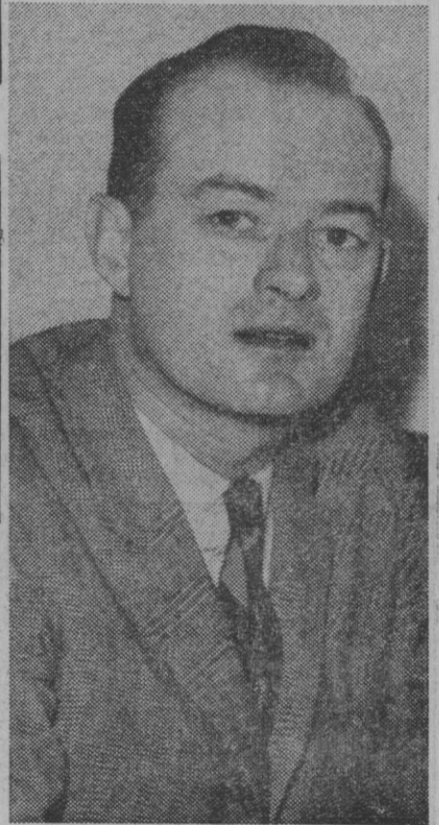
El escritor Manchester, autor de "Muerte de un presidente", y que ahora se encuentra hospitalizado pues padece neumonía

Las temperaturas extremas de la península han sido: máxima de 16 grados en Málaga, Almería y Alicante y mínima de 5 bajo cero en Cuenca.—Cifra.