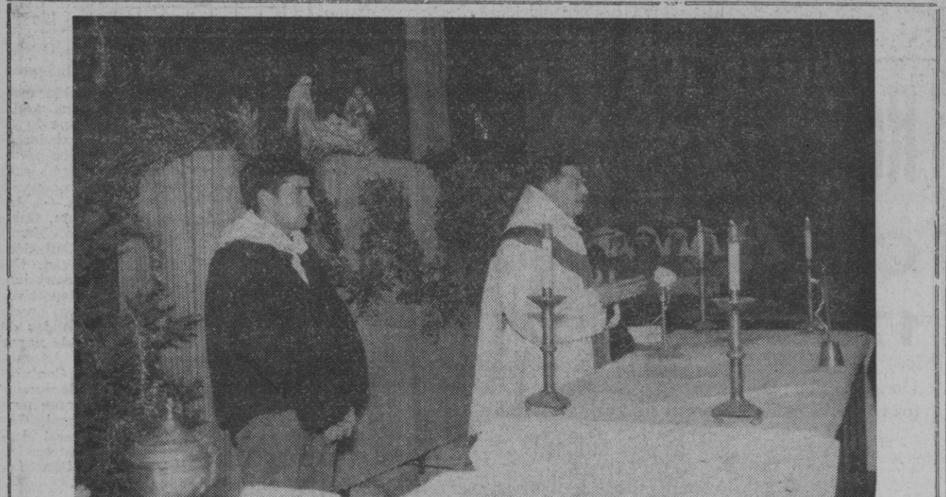
Pamplona.—El sacerdote oficiando la misa de medianoche en la Plaza de San Francisco de Pamplona y ante un portal de Belén. La misa fue encargada por la Peña "El Kirol" y a ella asistieron numerosos fieles que llenaron la plaza.

«Las normas de obligado cumplimiento en la contratación colectiva sindical: naturaleza jurídica, requisitos para su validez, efectos y recursos».—Cifra.