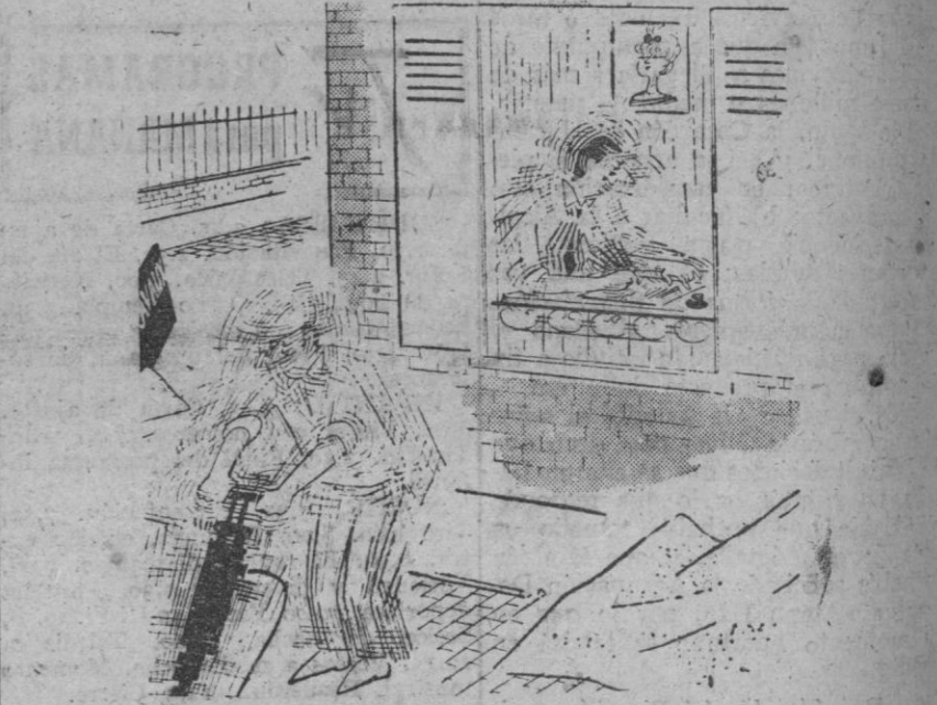
—Mi querida Lolita, la emoción que siento al escribirte hace temblar mi mano...