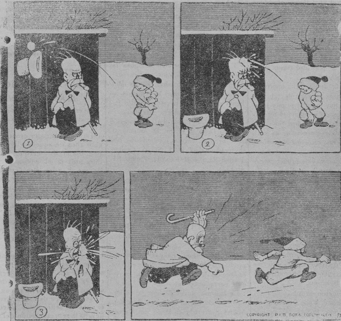
Adamson lo sufre todo menos que le toquen el cigarro