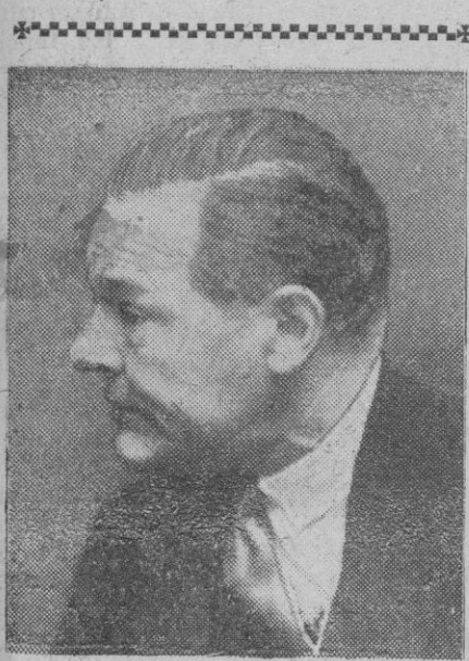
Henry Cabot Lodge, delegado americano en el Consejo de Seguridad de la O. N. U.

Madrid, 24.—La primera planta piloto para la producción de energía eléctrica utilizando la fuerza de las olas del mar, empezará a funcionar en España a primeros del próximo año, a base de las patentes de invención del químico español don Rafael Reyes Falla, y con los complementos que le proporcionan una serie de patentes extranjeras.