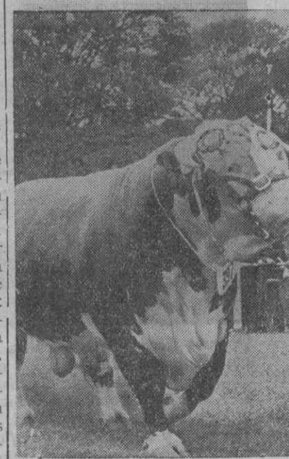
El toro de tres años "Temple Lictor", de la raza Hereford, campeón de una reciente exposición celebrada en Cardiff.

Debido a las adversas condiciones climatológicas, la saca de conejos en los vedados no podrá iniciarse hasta el día 15 de Julio.