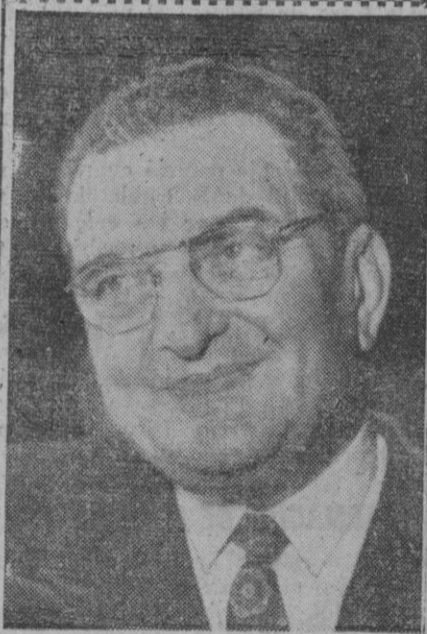
José Laniel, nuevo presidente del Consejo de Francia, que además de haber resuelto la última crisis, acaba de conseguir su primera victoria en la Asamblea, logrando poderes especiales para su Gobierno.

La señora de Odría en el Pilar, la tributo una calurosa acogida con vivas al Perú y a España.—Cifra.