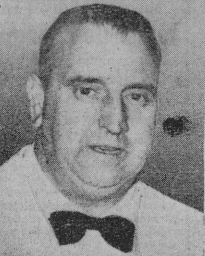
El ministro español de Asuntos Exteriores, señor Martín Artajo

Madrid, 4.—Esta noche, a las once y media, emprenderá su viaje a los países árabes, saliendo del aeropuerto de Barajas, el ministro de Asuntos Exteriores. El señor Martín Artajo y las personalidades que le acompañan se dirigirán a Beirut, en vuelo directo, en un tetramotor de la Compañía Iberia, que llegará a la capital libanesa a las diez y media de la mañana del sábado (hora libanesa).