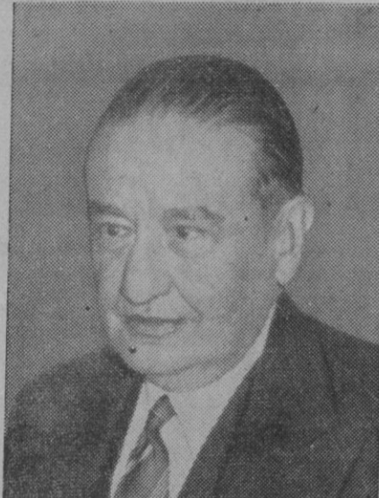
Maurice Petsche, ministro francés de Finanzas, que ha criticado severamente la política de devaluación del ministro de Hacienda inglés, sir Stafford Cripps