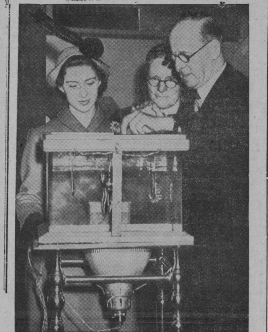
No son las exposiciones de objetos lugares donde se pierde el tiempo. Que allí, ante nuestros ojos, siempre hay cosas, que pasaron por fases de fabricación que nos son desconocidas. Este conocimiento desean adquirir aquellas personas a las que preocupa su cultura general, como sin duda alguna ocurre—su atención lo está denunciando—a la joven princesa Margarita de Inglaterra, que contempla el funcionamiento de un baño para el dorado de cubiertos sin perder silaba ni movimiento del platero que manipula en el aparato