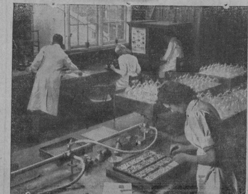
Las cosas que se dedican al suministro de semillas a clientes del mundo entero, realizan cuidadosos estudios para el mejor logro de su propósito, que no es otro que sus artículos alcancen un gran prestigio. La fotografía recoge una escena del trabajo en uno de estos laboratorios de ensayo para semillas