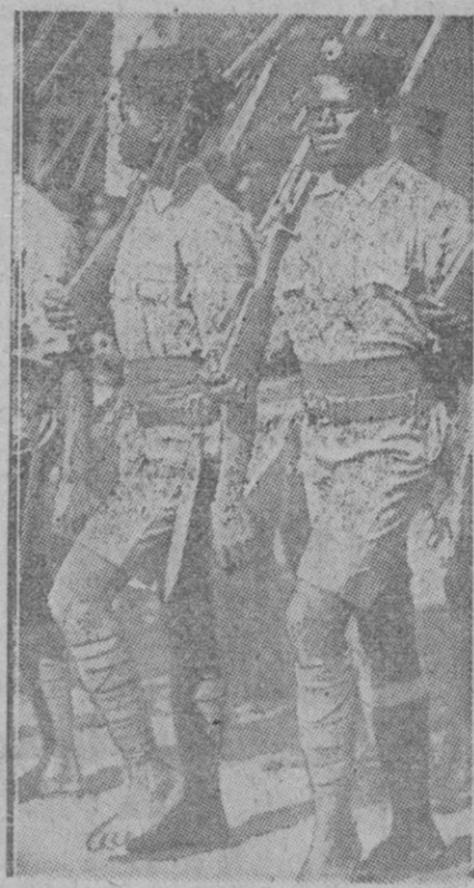
La llamada "República independiente de Liberia" cuenta con un ejército de varios millares de soldados. Recientemente los Estados Unidos han enviado a aquel Estado nominal fuerzas militares. En la fotografía vemos dos soldados de la citada República africana

Londres, 6 (2 t.).—Los combates en Madagascar han cesado a las catorce horas del día 5, por haber solicitado un armisticio las tropas francesas, según se declara autorizadamente en Londres. Efe.