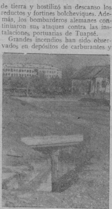
La batalla de Stalingrado es muy dura. He aquí uno de los muchos fortines soviéticos emplazados en los sitios más disimulados.

Posee, por lo tanto, unas líneas de defensa que miden por lo menos 50 millas de profundidad y puede permitirse el lujo de retroceder indefinidamente.»