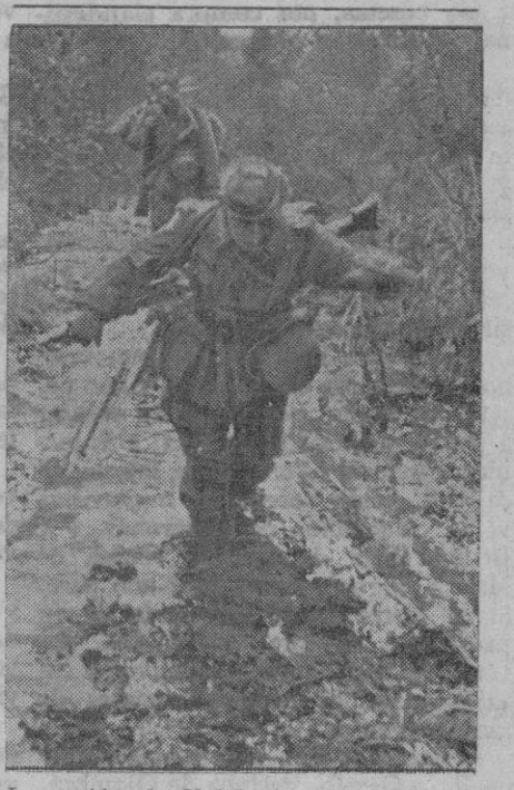
La región de Volchow, pantanosa por excelencia, ofrece serias dificultades para la lucha. He aquí una foto que muestra por donde tienen que caminar un grupo de soldados alemanes.

El embajador de la Argentina no estaba presente. Más tarde, el ministro de Colombia declaró que sus palabras no iban dirigidas contra Chile.—Efe.