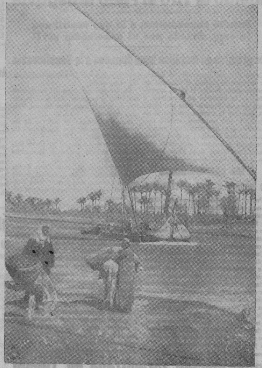
La paz y la laboriosidad humana parecen simbolizadas en este maravilloso paisaje egipcio, cruzado por el Nilo. Y sin embargo, la guerra está encendida a escasa distancia del histórico río. En un momento cualquiera el fragor de la lucha puede llegar a las encantadoras riberas

Comunicado italiano Roma, 27 (5 t.)—Comunicado del Cuartel General de las fuerzas armadas: Un intento de ataque del enemigo, contra el sector Sur del frente egipcio, fué rechazado por la pronta reacción de nuestros destacamentos, siendo capturados prisioneros. La aviación apoyó las operaciones terrestres y bombardeó repetidamente la retaguardia enemiga. Una incursión británica sobre Tobruk causó daños y algunas víctimas. Un avión que participó en la acción fué destruido por la D. C. A. de la plaza fuerte. Formaciones de «Spitfires» que se esforzaron en interceptar el paso a los bombarderos del Eje que regresaban después de haber alcanzado eficazmente las instalaciones militares de Malta, fueron atacadas por los cazas alemanes e italianos. Los alemanes derribaron en duelo aéreo, dos aparatos enemigos.—Efe.