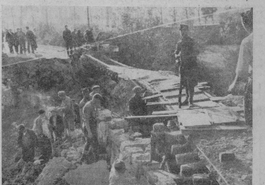
Soldados nacionales reconstruyendo un puente destruido por los rojos.

De ello se ufana el principal artífice de aquel crimen contra la Patria. Hubiera España tenido un Ejército entonces y la guerra habría sido breve. Aun mejor, la ola roja habría sido contenida a tiempo. Unos pocos, muy pocos, regimientos mecanizados, por ejemplo, y la guerra se habría reducido a un simple motín, en la peor de las posibilidades. El mal del desarme de España tenía, sin embargo, raíces remotas. Ciertos partidos políticos no querían un Ejército fuerte, con el pretexto de que ello podría provocar los «pronunciamientos». Preferían gobernar en la impunidad más absoluta. En 1918, Cierva tuvo el deseo de remediar un Estado de cosas ya