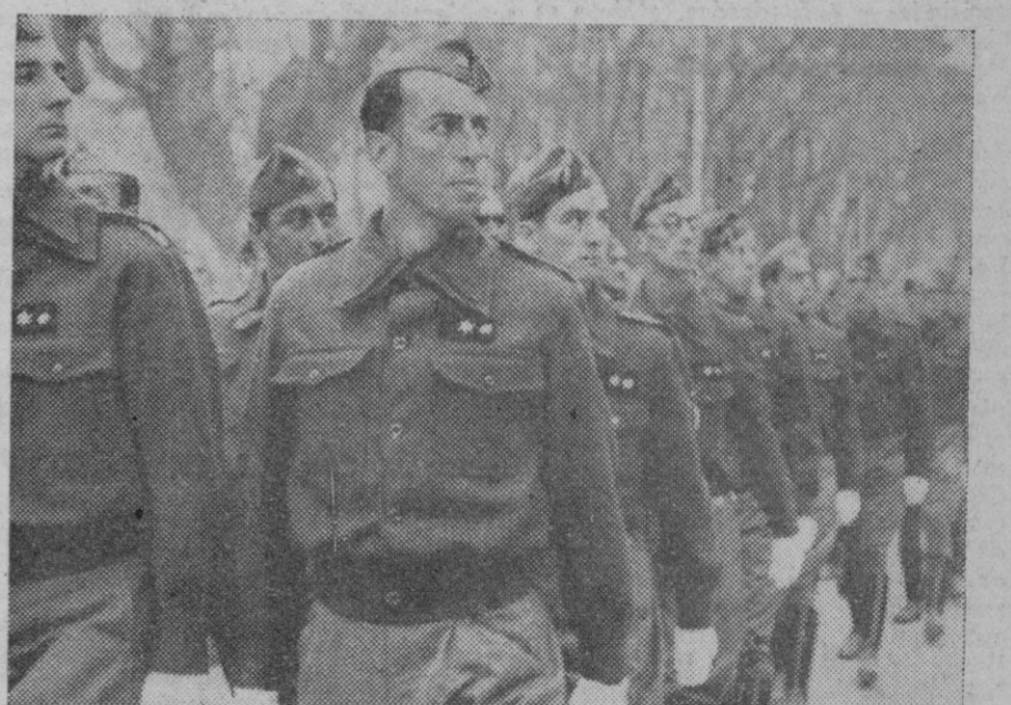
Jura de caballeros alféreces en Burgos

La empresa, sin embargo, tenía que ser larga y penosa. Nada más caro para un pueblo que no tener Ejército. Y en julio de 1936, en España no había Ejército. La República, sana y conscientemente, le había «triturado».