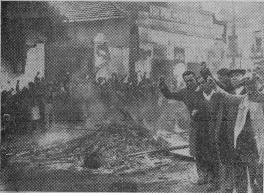
Madrid.—Primeras consecuencias del triunfo del Frente Popular. Asaltos e incendios y puños amenazadores.