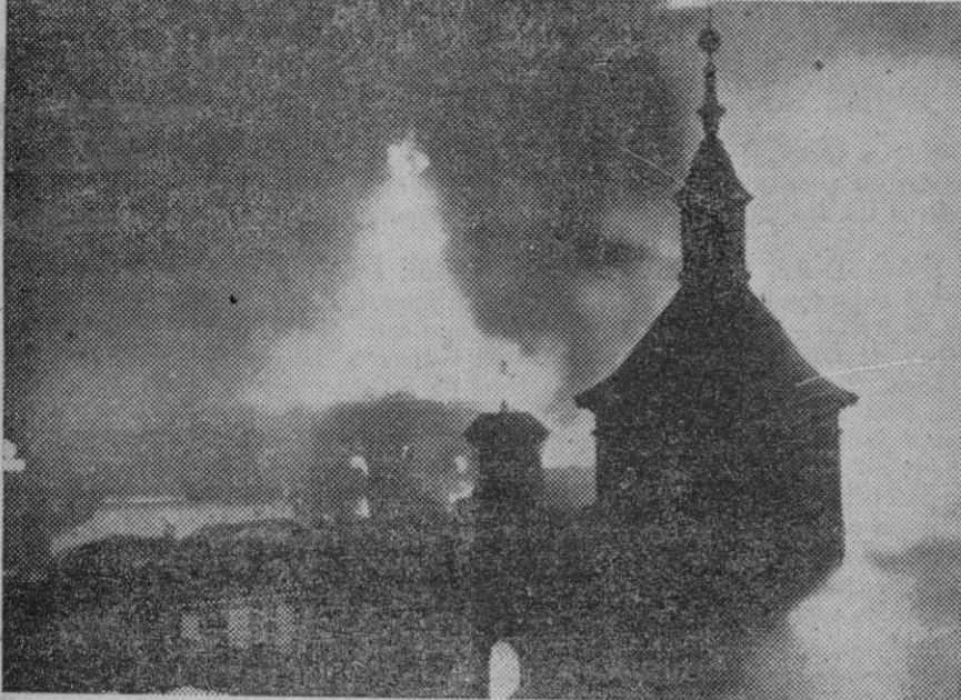
Madrid.—Triunfante el Frente Popular, no tardan en reproducirse los incendios de iglesias. La primera de esta nueva etapa, que culminará en la guerra, es la parroquia de San Luis.