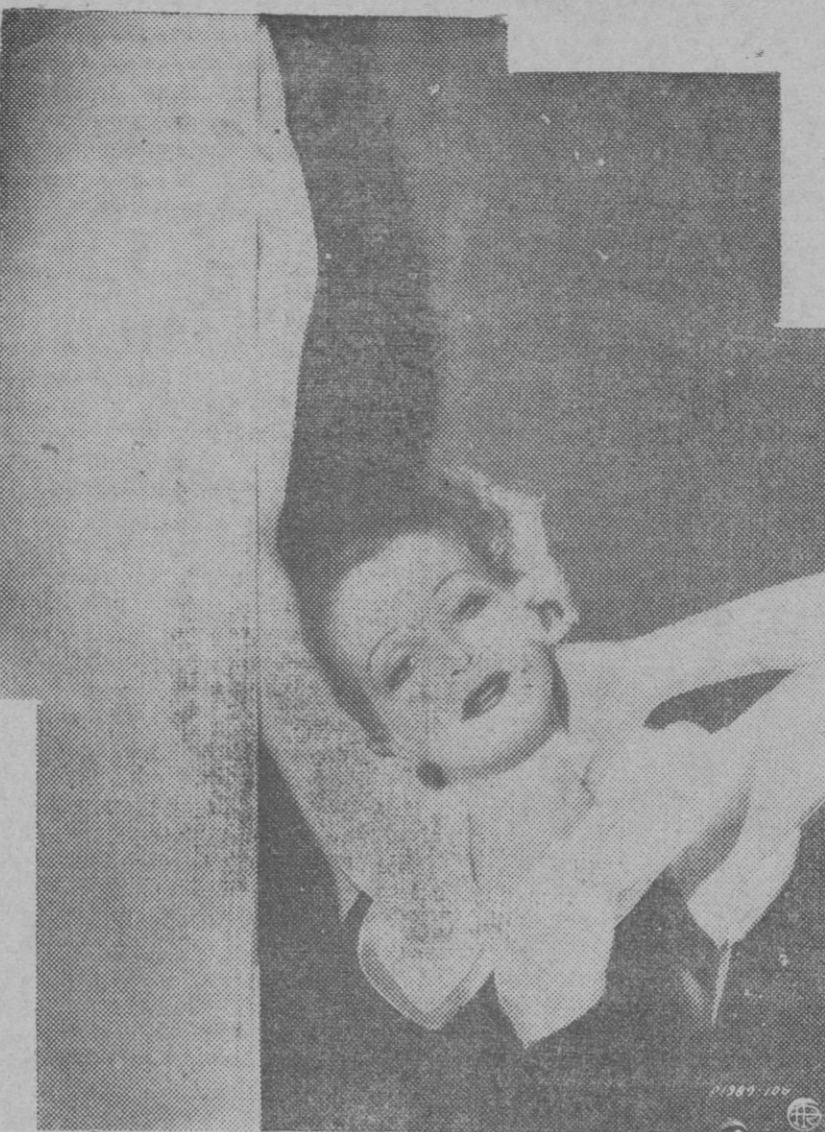
Frecuentemente las más notables actrices de Hollywood ofrecen a la contemplación universal las maneras de un sugestivo desparejamiento al enfrentarse con la cotidiana tarea.

—Yo no lo sé—contestó el señor Irarzo—. Pero es igual, porque nosotros