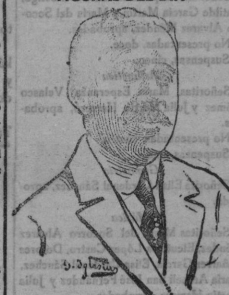
Don José de Sartorius, Conde de San Luis, nuevo ministro de Abastecimientos.