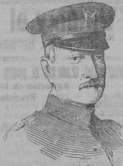
GENERAL PERSHING comandante en jefe del primer ejército que Norte-América envía a Francia.