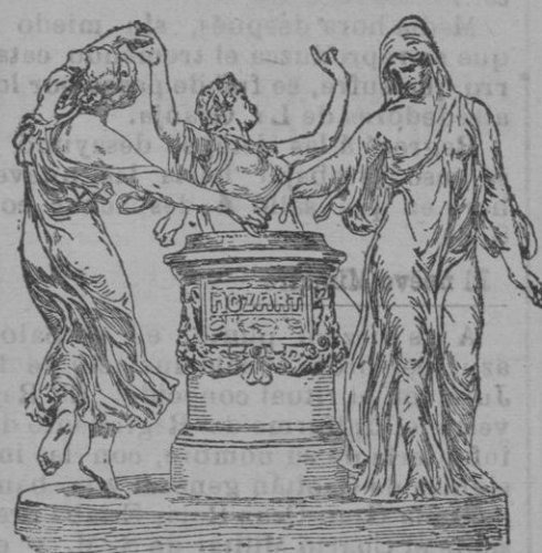
Monumento á Mozart, descubierto el 16 de Junio en Dresde, de que es autor J. Jossens.