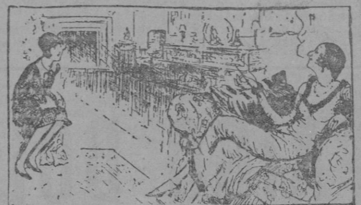
—Lamento no poder contribuir a su obra con mis vestidos viejos, porque ya los he prometido, pero creo que mi capote le cederá dos o tres de nuestros coches, ya algo usados.