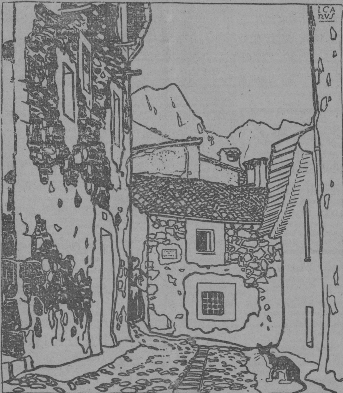
LA CALLE DEL VIENTO, FORNALUTX

nes más elevadas, resulta que su tristeza es la más dulce, la más consoladora y la más bella de las tristezas. Por esto practican el quietismo y viven una vida monótona, es decir, viven lo menos posible. Y por esto su casa se conserva austera y destartada y no hay labores de crochet en las habitaciones.