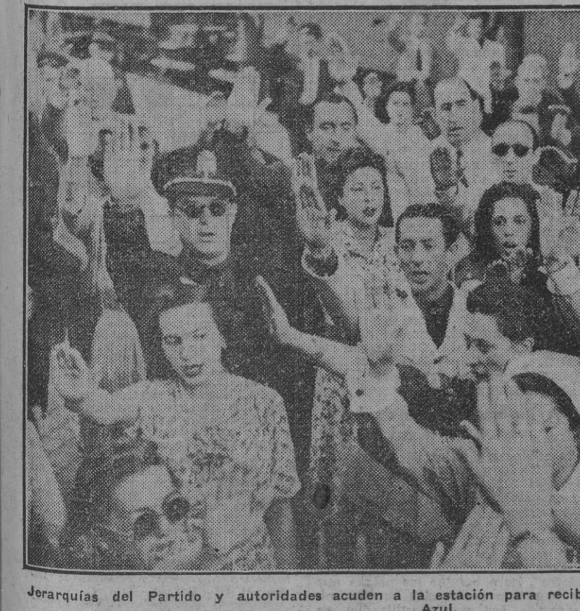
Jerarquías del Partido y autoridades acuden a la estación para recibir a las enfermeras de la División Azul.

SANTANDER, 17.—En la Alcaldía se ha recibido una comunicación oficial del Instituto de Crédito para la Reconstrucción dando cuenta de haber sido aprobado por el Consejo del mismo un crédito por 30.713.355 pesetas, solicitado por el Ayuntamiento para la ejecución de obras de urbanización de la zona si-