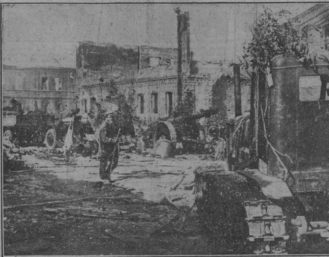
Las grandes concentraciones de material soviético ofrecen un excelente blanco a los bombarderos en picado alemanes. La plaza mayor de esta ciudad ribereña del Don ofrece un aspecto de caos por los cañones y vehículos de todas clases destrozados por un cacertero bombardeo.