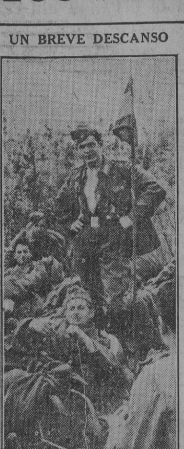
UN BREVE DESCANSO