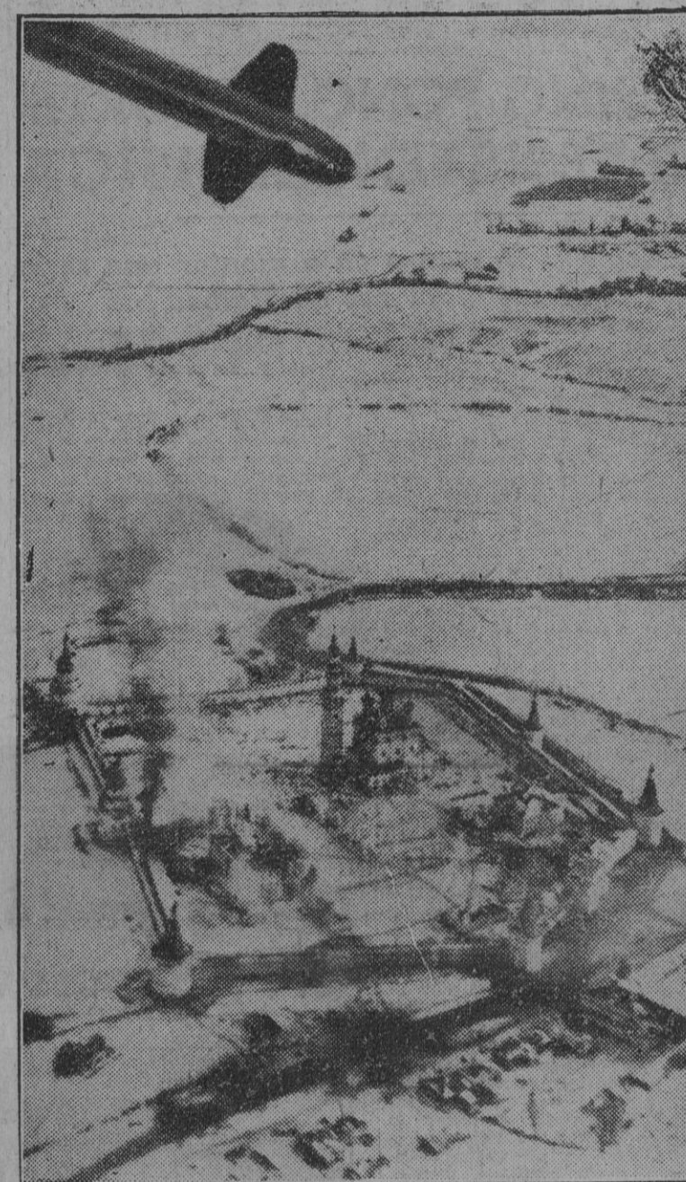
El Kremlin de Terjajew, al noroeste de Moscú, bajo un intenso ataque de los bombarderos alemanes en picado. El gran detalle de la foto permite apreciar la eficacia de los aviadores del Reich.