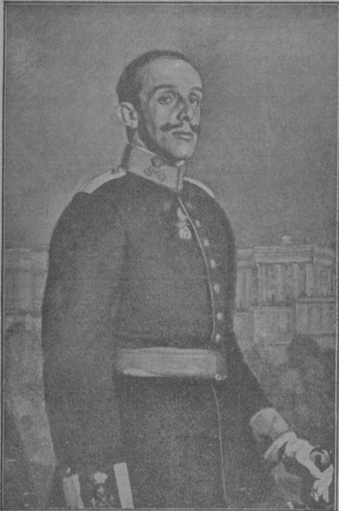
S. M. el Rey Don Alfonso XIII