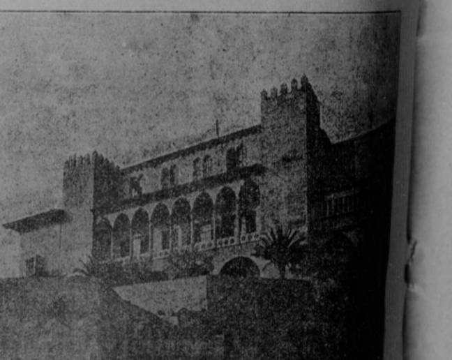
Palacio de la Almudaina, de los antiguos Reyes de Mallorca, tendrá lugar la recepción

Para esta mañana a las nueve y media están convocados a una reunión en el Palacio de la Diputación Provincial, los concejales de este Ayuntamiento que han de sostener las varas del pajo, vestidos