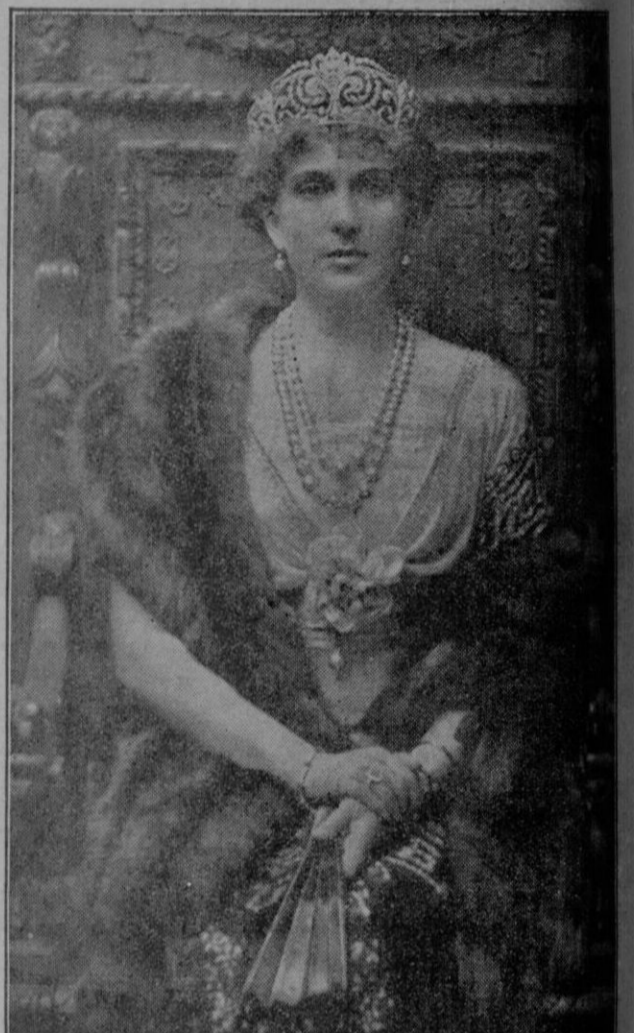
S. M. la Reina Doña Victoria