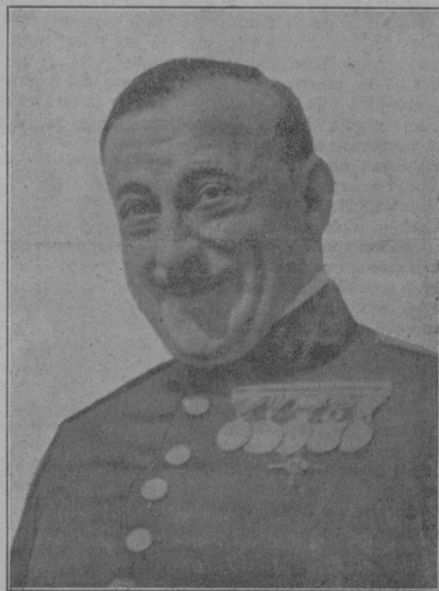
Sr. Marqués de Estella, Presidente del Directorio

Es amor y es egoísmo, humano, no falaz, el deseo de hacer frecuente y sosteniendo el contacto del pueblo con sus Soberanos, a quienes damos con todo respeto la bienvenida, y hacemos votos para que su estancia en Mallorca les sea grata y al marcharse lleven un recuerdo que perdure como el de horas rebosantes de felicidad, la felicidad que nace del convencimiento de la posesión del afecto sincero de sus súbditos y de la comprobación de la decantada belleza de estos sus dominios.