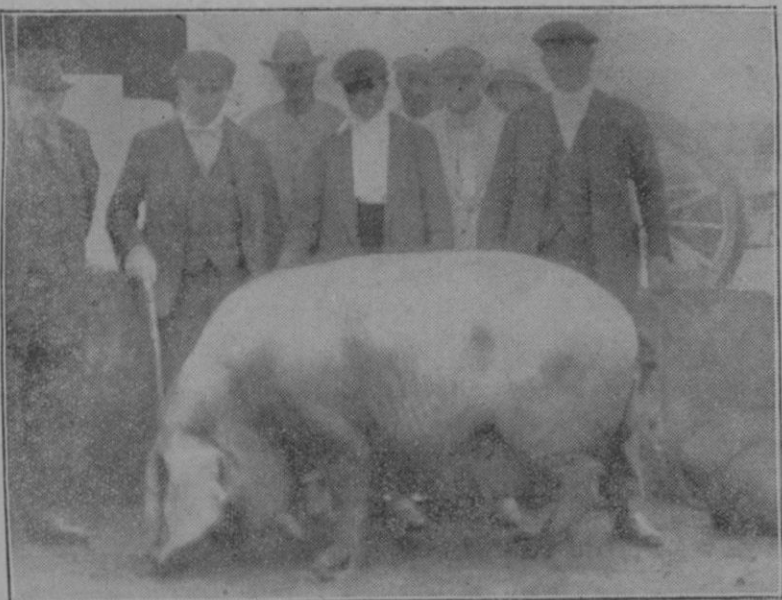
Cerdo de 33 arrobas, hermoso ejemplar de la raza mallorquina, pocas veces igualado.

quete que se organizó en la casa para festejar el sacrificio del untuoso animal se sintieron enfermos; varios ya han fallecido.