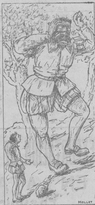
¡Aixó no és manera de siular!

Amb una grapada se lleva's mocador, y vos asegure que en feya d'espants, sense conèixer que era estada una pedra y no es siulo lo que li era arribat devers s'oreya. —¡Ah idó! esclama es geperut. —¡Ja vos deya jo que siularia mes fort, y que vos guanyaria de massa...! No, y ara vos torn defiar a tirar enfora... —¡Ja estich massa defiat! diu es gigant. —¿Vol dir vos donau de tot? esclamá es geperut. Y tantes n'hi digué, que's gigant allargà's coll a una altre provetura, y aquesta va esser a veure qui tiraria mes enfora.