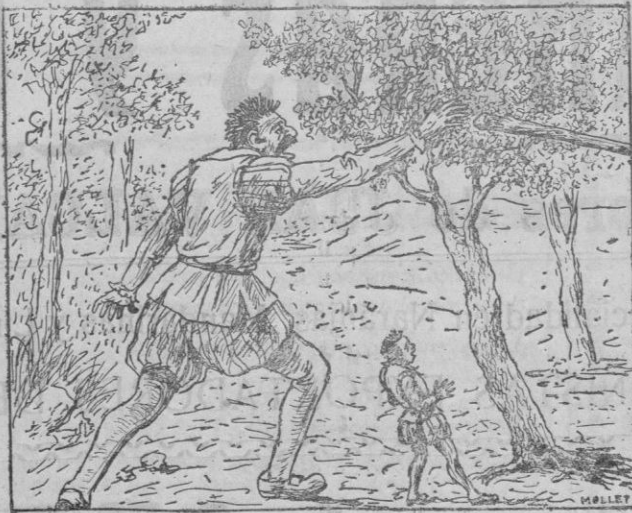
La branda una estona, la tira.

Amb una grapada se lleva's mocador, y vos asegure que en feya d'espants, sense conèixer que era estada una pedra y no es siulo lo que li era arribat devers s'oreya. —¡Ah idó! esclama es geperut. —¡Ja vos deya jo que siularia mes fort, y que vos guanyaria de massa...! No, y ara vos torn defiar a tirar enfora... —¡Ja estich massa defiat! diu es gigant. —¿Vol dir vos donau de tot? esclamá es geperut. Y tantes n'hi digué, que's gigant allargà's coll a una altre provetura, y aquesta va esser a veure qui tiraria mes enfora.