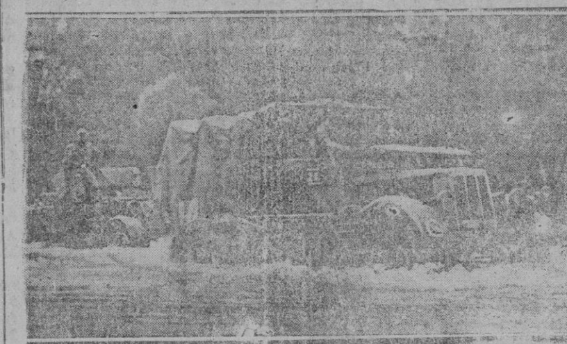
PARA EL AVANCE ALEMÁN EN EL CAUCASO NO HAY OBSTACULOS.—Camiones especiales del Ejército alemán salvan un río en su avance hacia el Sur del Cáucaso, a través de la zona montañosa.—Foto PRESAMUNDO.

El Cardenal Secretario de Estado Magliana ha salido esta mañana para Casoria, donde pasará sus vacaciones.—Efe.