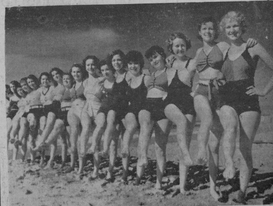
Este grupo de encantadoras muchachas californianas se prepara para entrar en un concurso de trajes de baño en la playa de Venecia (Estados Unidos).

Por la parte interior, cada país debe establecer el equilibrio en su hacienda pública y en las empresas económicas particulares, industriales y agrícolas, las cuales, bajo el régimen que no es comunista, son la base de toda la producción nacional, y por consiguiente, sus condiciones necesitan ser respetadas y aseguradas por parte de los poderes públicos.