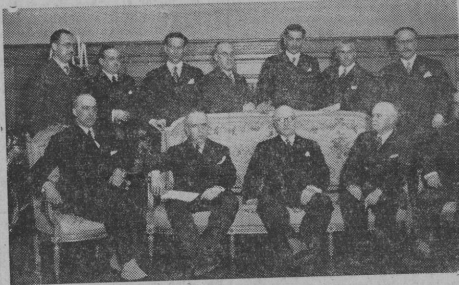
Bajo la presidencia de S. E. se reunieron los nuevos ministros del Estado en el Palacio Nacional. Durante el acto el Jefe de Estado, pronunció un discurso sobre la Política Internacional.

ticular para los elementos económico-mercantiles de la misma, es de esperar que tal iniciativa sea secundada por todos los elementos de la población, y que ese apoyo sea entusiasta y en cuantía eficaz para garantizar el éxito de la empresa.