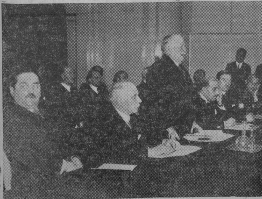
Bajo la presidencia de M. Gastón se inauguró en el instituto Barthel el primer congreso de la Unión Nacional para la Defensa Aérea. M. G. Doumergue pronunciando el discurso de apertura.