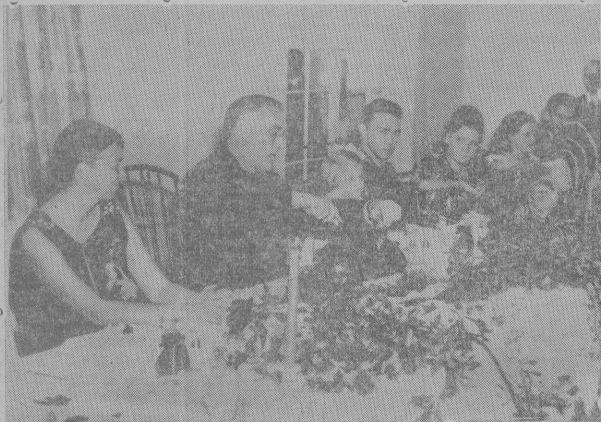
EL PRESIDENTE ROOSEVELT, PRESIDE UNA FIESTA DE LA FUNDACION CONTRA LA PARALISIS INFANTIL. — El presidente Franklin D. Roosevelt, que además de otras muchas cualidades, posee la de saber cortar con perfección el pavo, en pleno trabajo durante la fiesta celebrada a beneficio de la Institución contra la Parálisis Infantil