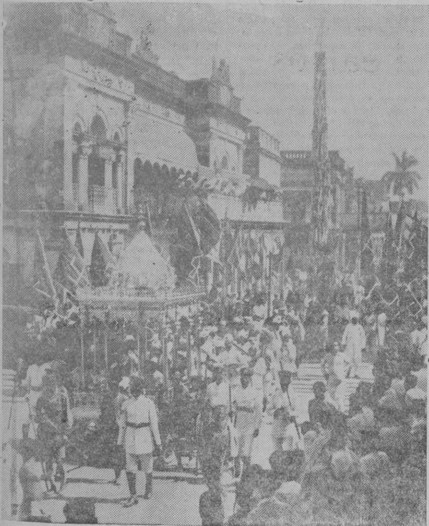
UNA PINTORESCA FIESTA EN LA INDIA. — La pintoresca procesión anual de Jains Paresnath pasando por las calles de Calcuta. Esta procesión tiene la particularidad de que es necesario cortar todos los años los hilos de alumbrado y teléfono que cruzan las calles, para dar paso al sagrado ihanda que puede verse a la derecha de la fotografía. Miles y miles de personas presenciaban el paso de esta típica procesión.