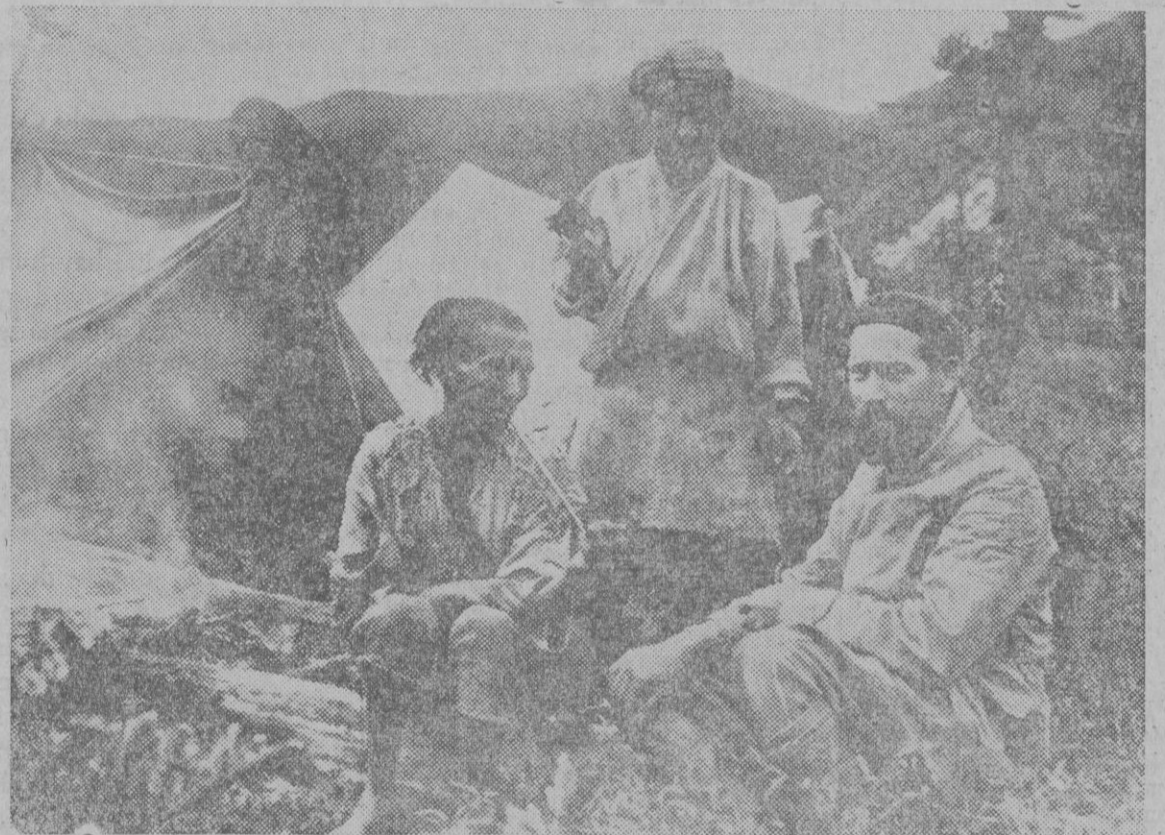
LOS MONJES DE SAN BERNARDO EN EL HIMALAYA. — Monjes suizos del Monasterio de San Bernardo, están actualmente tratando la compra de terrenos en el Himalaya, donde tienen intención de construir un Monasterio para practicar las mismas obras de caridad que en el monte de San Bernardo. Un monje, con traje de expedicionario, tratando con los nativos.