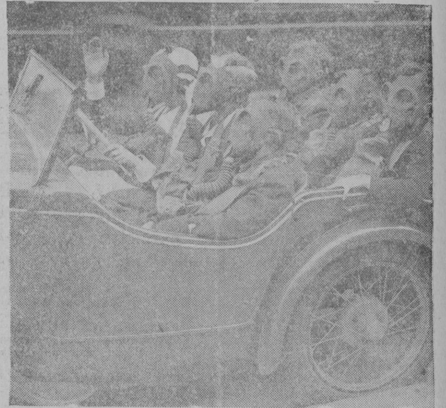
NI LOS NIÑOS SE LIBRAN DE LAS MOLESTIAS DEL ARMAMENTO. — Siempre bajo el temor de una posible guerra, los ingleses, hombres previsores, han llegado en su preparación hasta a entrenar a los pequeños escolares a llevar las caretas contra los gases asfixiantes para que no les venga de nuevo si llega el día de usarlas. Un aspecto tético y casi inhumano, que ofrecen 5 escolares en prácticas contra los gases.