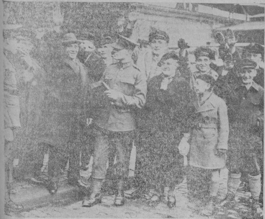
TROPAS INGLESAS EN EL SARRE. — Las tropas inglesas llegadas a Sarrebruc, empiezan a entrar en contacto con la población. — Habitantes de Sarrebruc saludando a dos «Tommys» con el saludo «nazi».