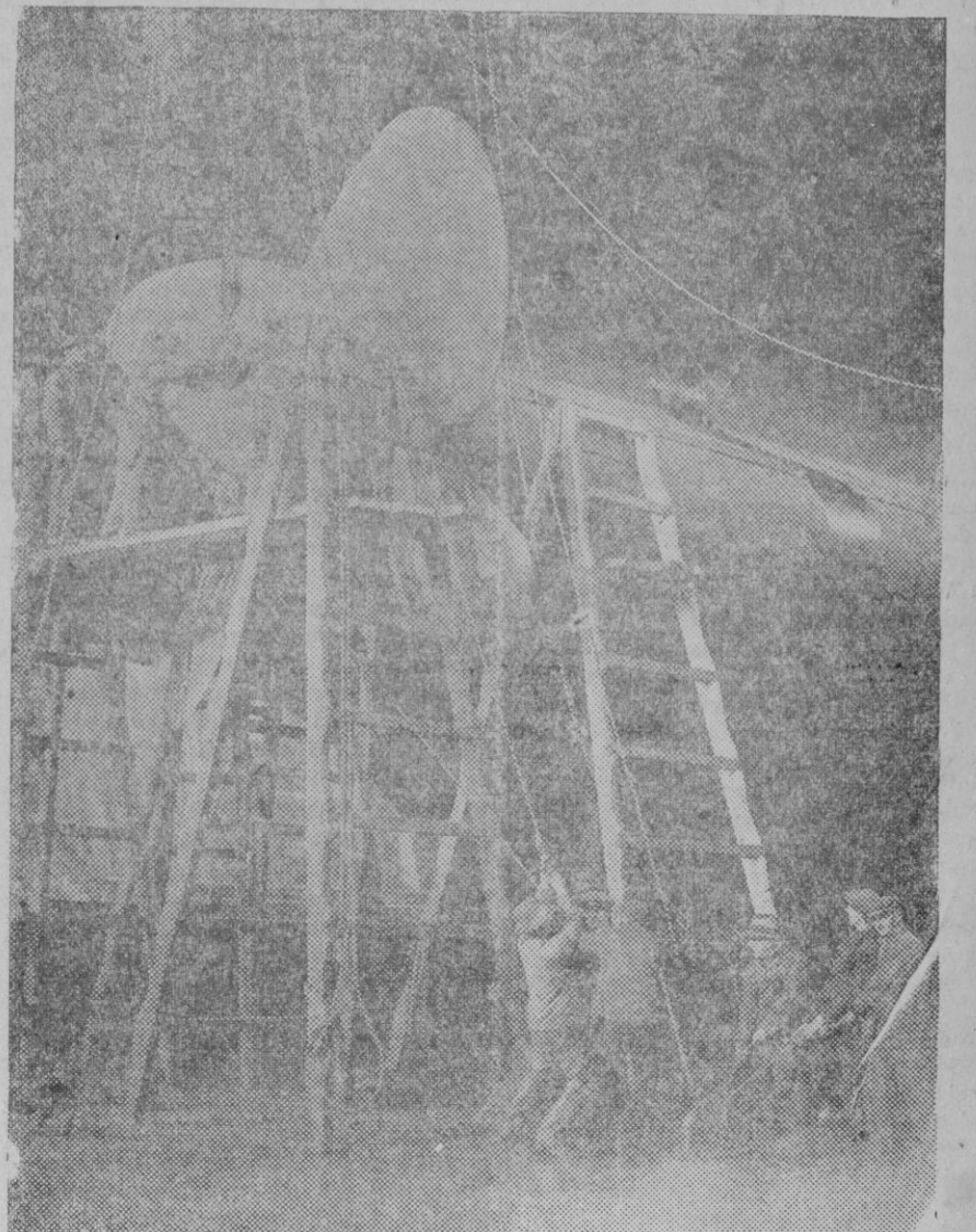
EL GIGANTESCO EMPRESS OF BRITAIN, de la White Star Line, se prepara para una dura prueba en los astilleros de Southampton, para una larga travesía, un crucero alrededor del mundo en el que intentará batir todos los records de velocidad establecidos hasta el día. Aquí vemos una de las hélices del