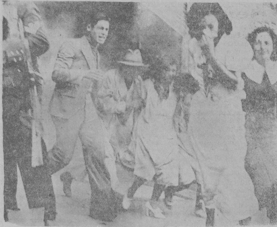
EL USO DE LOS GASES LACRIMOGENOS. — En la ciudad de Méjico, con motivo de las manifestaciones estudiantiles, el uso de gases lacrimógenos ha demostrado de nuevo su eficacia: en efecto la policía ha podido disolver todo género de demostraciones sin causar víctimas como hubiese ocurrido con el empleo de las armas de fuego. Estudiantes huyendo de los gases.