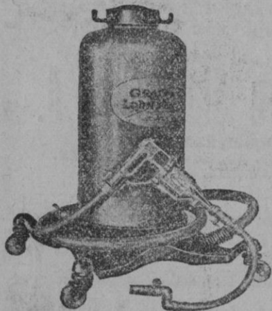
Equipo Engrase en pistola automática CRACO