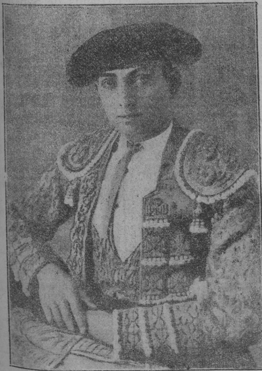
Joaquín Rodríguez "Cagancho."