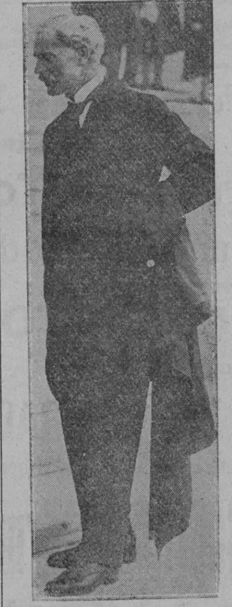
Mister Ramsay Macdonald, saliendo de Downing Street, momentos antes de partir para Ginebra "El primer" inglés

El público se dió cuenta de la manobra y se precipitaron tras las bellezas que hubieron de refugiarse en una iglesia próxima. La multitud continuó largo rato