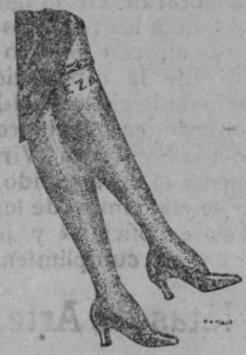
de vania. LA JAVA PALMA