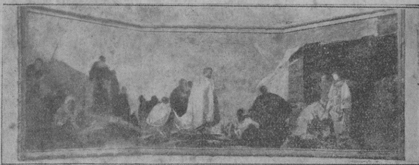
Adoración de los Reyes Magos, de Goya

responsabilidades, pero tengá presente que las apariencias humanas y los distingos sólo ante los hombres tienen validez académica, pero que ante Dios no valdrán los sofismos y encogimientos de hombros ni mucho menos la timidez y la poca armonía en defender contra viento y marea la verdad, la única verdad, que encierra el sacramento del matrimonio.