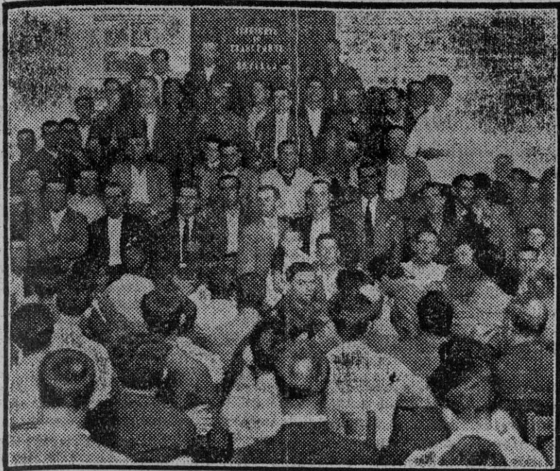
La Asamblea de los obreros del puerto, celebrada en su domicilio social, Sindicato de Transportes de Sevilla