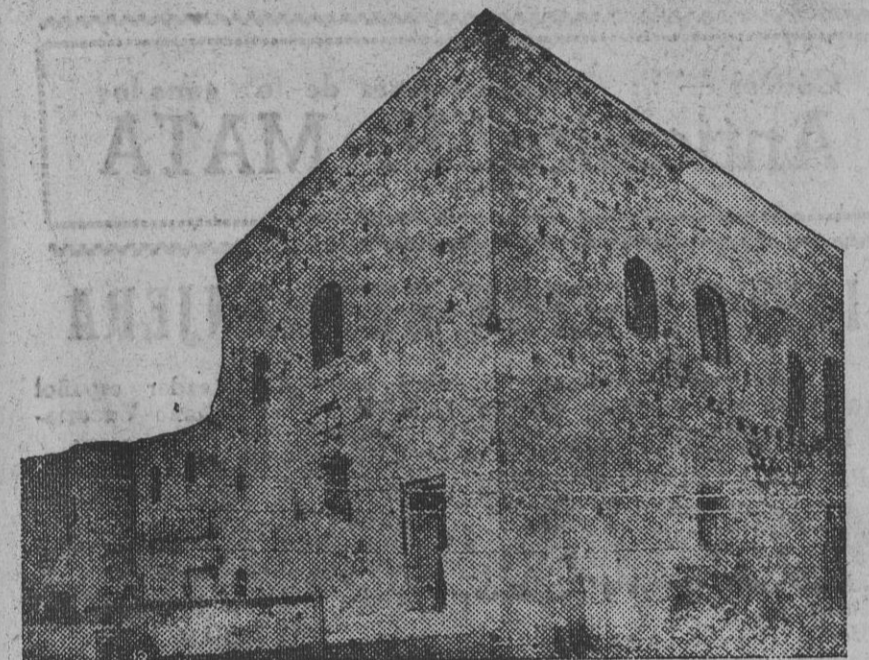
Ruinas del Alcazar de Diego Colón ó Casa del Almirante (estado actual)

La actual República Dominicana fausto extraordinario. En sus cimientos (verdaderas canchales reyes) nacieron los siete hijos de los virreyes: Felipa, María, Juana, Isabel, Diego, Cristóbal y Luis, este último tercer almirante de las Indias y primer duque de Veragua; y murieron la bella y sufrida esposa de don Diego, el 11 de Mayo de