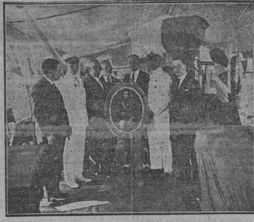
La Comisión de la Asociación de Tiradores que hizo entrega, a bordo del «Nimphes», del retrato del Rey, como recuerdo de su estancia en Sevilla, a los marinos alemanes.