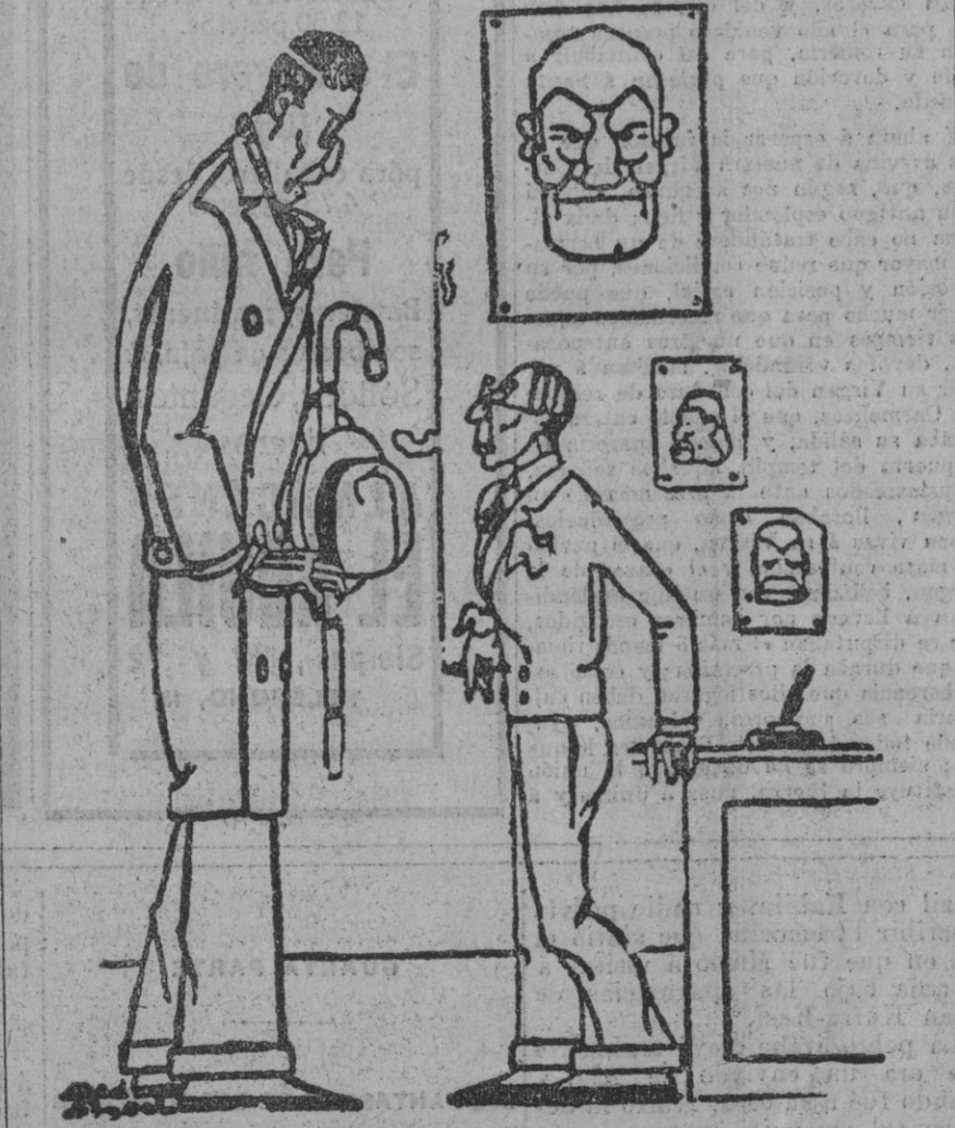
LAS SORPRESAS DEL PERIODISMO. —Quisiera ver al redactor que firma la sección de deportes con el seudónimo de «El Atleta Completo». —Soy yo.

El juez tomará declaración al lesionado y procederá contra los individuos que sostuvieron la referta y que el lesionado dice conocer.