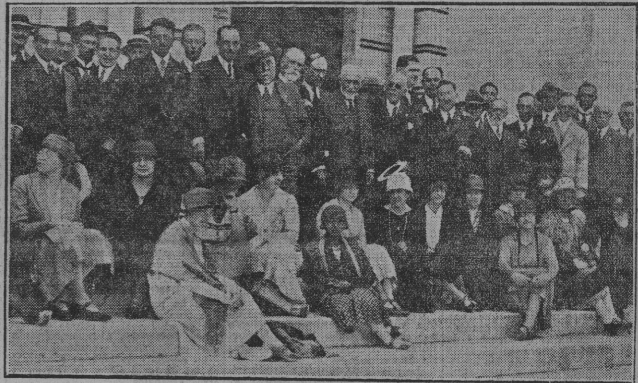
Los congresistas de Geología durante su visita a los edificios de la Exposición Ibero-Americana.