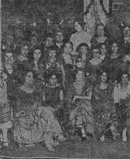
Un grupo de bellas concurrentes a la fiesta andaluza celebrada anoche en el patio del ex convento de San Jacinto en honor de los congresistas geólogos.

El juez del Salvador, después de oír a la agresora, la puso en libertad.