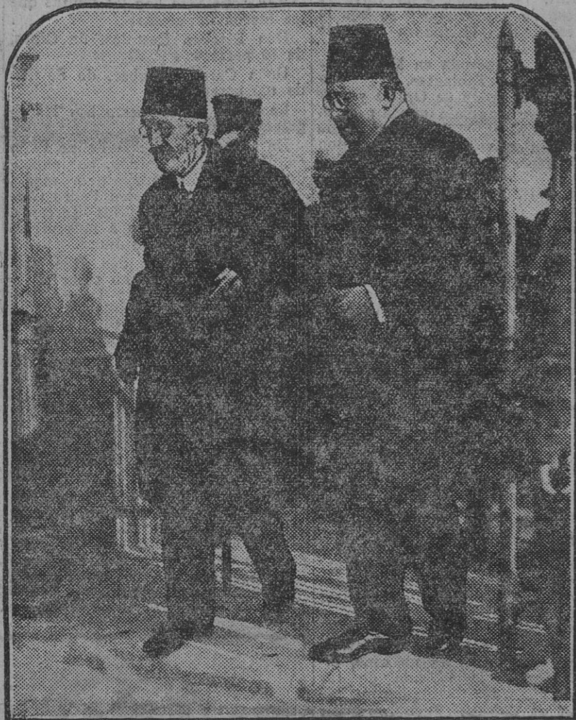
Ultimo retrato de Mahomet VI, ex Sultán de Turquía muerto en San Remo (Italia), a cuyo cadáver le ha sido practicada la autopsia a fin de comprobar la denuncia formulada acerca de un supuesto envenenamiento.

Y esto no es todo. Los chauffeurs han recibido orden de moderar la marcha de sus vehículos al pasar ante esos funébreos monumentos.