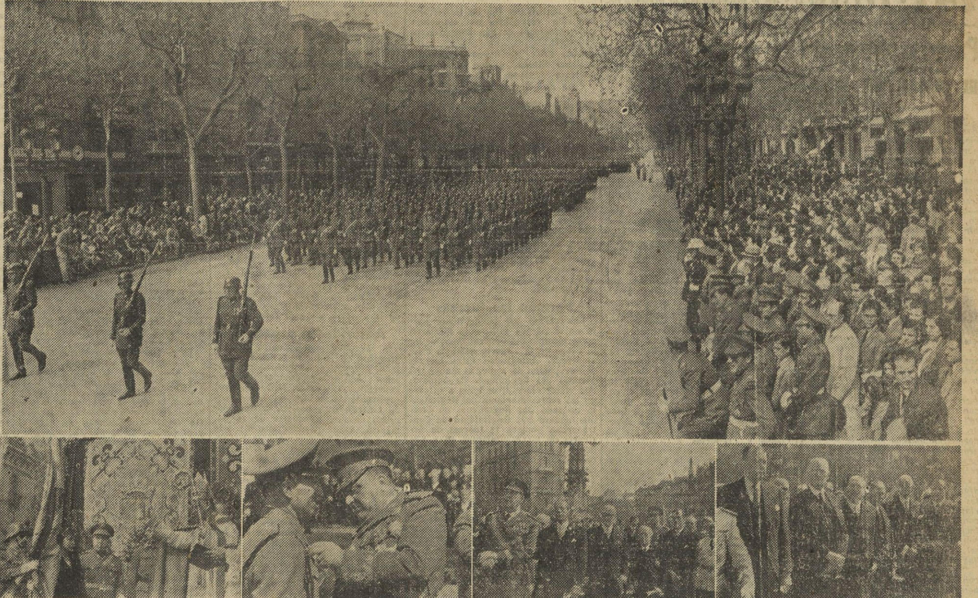
DIA DE LA VICTORIA EN BARCELONA. 1. BENDICION DE UNA BANDERA. — 2. IMPOSICION DE CONDECORACIONES. — 3. MOMENTO DE LA MISA. — 4. EL CUERPO DIPLOMATICO