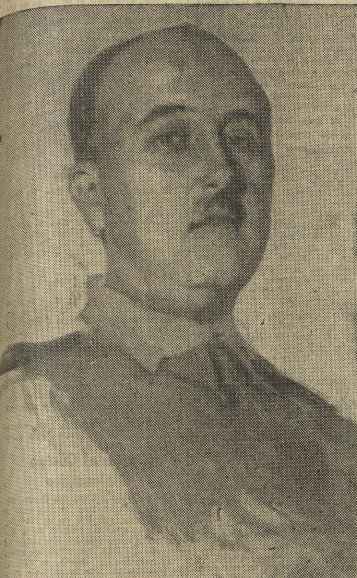
EL JEFE DEL ESTADO Y GENERALISIMO DE LOS EJERCITOS, COMANDANTE EN JEFE DE LA FUERZA ARMADA ESPAÑOLA, EN LA VICTORIA EUROPEA CONTRA EL COMUNISMO

2 NOTICIAS RESANTES DE MA HORA 1 SIN PONERSE DE ACUERDO 2 POLES SERA RECHU CO UN INFORME EISENHOWER 3 NOTA TA 4 5 6 7 8 9 10 11 12 13 14 15 16 17 18 19 20 21 22 23 24 25 26 27 28 29 30 31 32 33 34 35 36 37 38 39 40 41 42 43 44 45 46 47 48 49 50 51 52 53 54 55 56 57 58 59 60 61 62 63 64 65 66 67 68 69 70 71 72 73 74 75 76 77 78 79 80 81 82 83 84 85 86 87 88 89 90 91 92 93 94 95 96 97 98 99 100