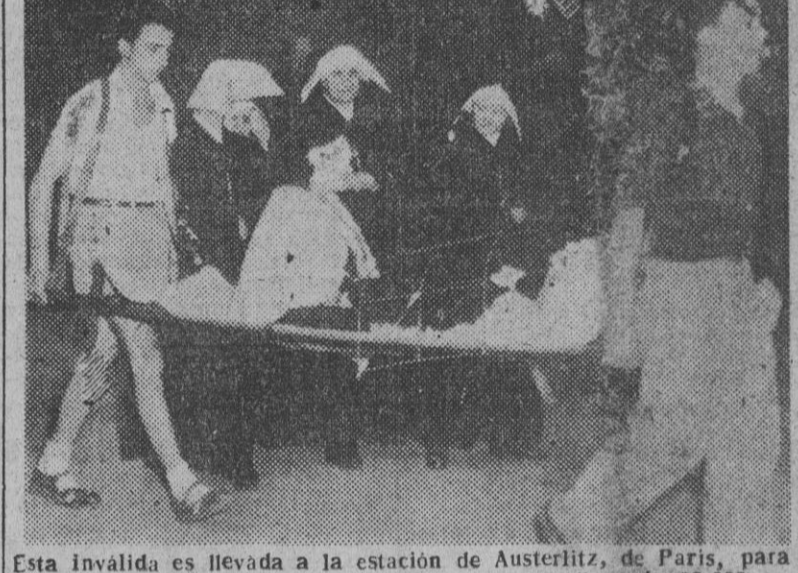
Esta inválida es llevada a la estación de Austerlitz, de París, para tomar uno de los 15 trenes especiales que están llevando 20.000 peregrinos, entre ellos 1.100 inválidos, en una peregrinación a Lourdes