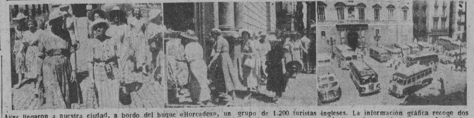
Ayer llegaron a nuestra ciudad, a bordo del buque «Horcaes», un grupo de 1.200 turistas ingleses. La información gráfica recoge dos momentos de la visita que efectuaron al Ayuntamiento y la Diputación, y los autocares que conducían a los pasajeros, aparcados en la Plaza de San Jaime.